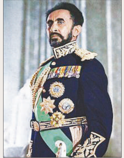
ዐፄ ኃይለ ሥላሴ

እንዲያደርግላቸው ጥያቄ ማቅረባቸውን የሚያሳይ ደብዳቤ በሰነድ መልክ ይገኛል።