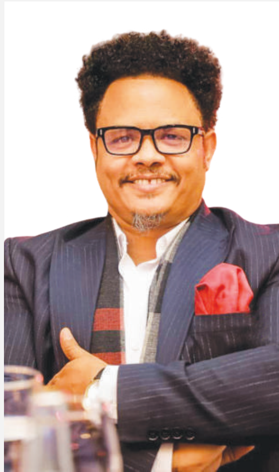
ፓስተር ቸርነት በላይ

በአዲስ አበባ ፖሊስ የሕዝብ ግንኙነት ዳይሬክተር ምክትል ኮማንደር ማርቆስ ታደሰ ግብረ ሰዶማዊነት ከኢትዮጵያ ሕግ አኳያ ወንጀል መሆኑን ይገልጻሉ። በኢ.ፌ.ዴ.ሪ የወንጀል ሕግ ከአንቀጽ 6 : 29 እስከ 31 እንደተደነገገው ድርጊቱ ወንጀል መሆኑ ብቻ ሳይሆን የሚያስከትለው ተጽዕኖ ጭምር በግልጽ ሰፍሯል። ምክትል ኮማንደር ማርቆስ ሕጉን