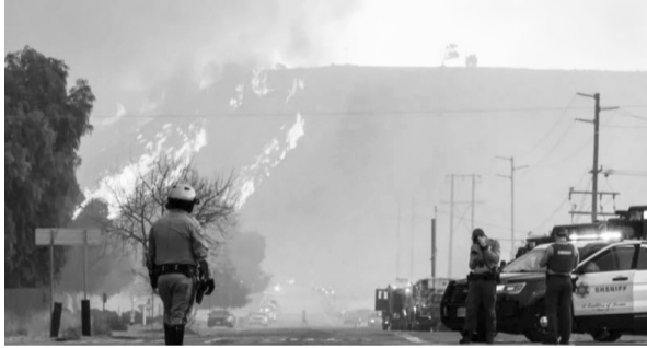
አዲሱ ሰይድ አሳት ወደ ሰሜንዋይ አቅጣጫ እየተስፋፋ ሲሆን፣ ባለፉት ሳምንታት በተነሳው ሰይድ አሳት ሳቢያ እነዚህ አካባቢዎች አሁንም እየተቃጠሉ ነው። በሳን ዲዮና አሸንጎይድ ሁለት ሌሎች ሰይድ አሳቶች መነሳታቸውም ተገልጿል። የአሳት አደጋ ሠራተኞች እሳቶቹን መቆጣጠር ችለው ነዋሪዎችንም ከአካባቢው አስወጥተዋል።

ከቁጥጥር የወጣው ሰይድ አሳት ከ3 ሺህ 723 ሄክታር በላይ ተስፋፍቷል። በነፋስና በደረቅ ደን ምክንያት የሚስፋፋበት ፍጥነት ጨምሯል። ቤትም ይሁን የገግድ ቦታ በሰይድ አሳቱ ባይጎዳም ወደ 31,000 ነዋሪዎች ለመሸሽ ተገደዋል። ከአሜሪካ ምሥራቃዊ ክፍል ወደ ሜክሲኮ ካናዳ የሚወስደው አውራ ጎዳና ተዘግቷል።