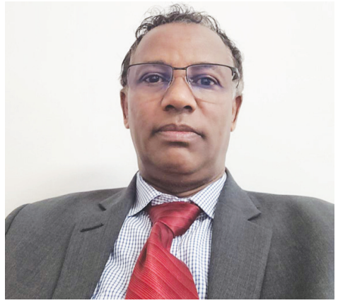
ከተማ መስቀላ (ዶ/ር)

የንግድ ምክባብና ፍቃድ አሰጣጥ በአንላይን እንዲሆን ውጤታማ ሥራ መሠራቱን አንስተው፤ በዚህ ረገድ ብልሹ በስድስት ወራት... ወደ ገጽ 4 ዞሯል