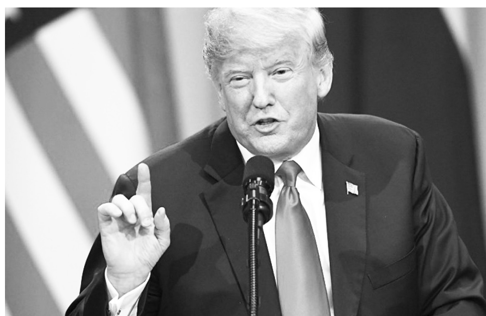
የሌላቸውን ስደተኞች ከአሜሪካ እንደሚያባርሩ ቃል ገብተዋል። ነገር ግን የስደት ተንታኞች የትራምፕ ዕቅድ ብዙ ሕጋዊ፣ የሎጂስቲክ፣ የገንዘብ እንዲሁም የፖለቲካ አንድምታ አለው ሲል ቢቢሲ ዘግቧል።