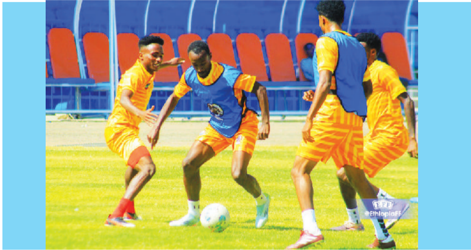
ዋልዎቹ የሀገር ቤት ዝግጅታቸውን አጠናቀው ትናንት ምሽት ወደ ቤንጋዚ ተገዘዋል።