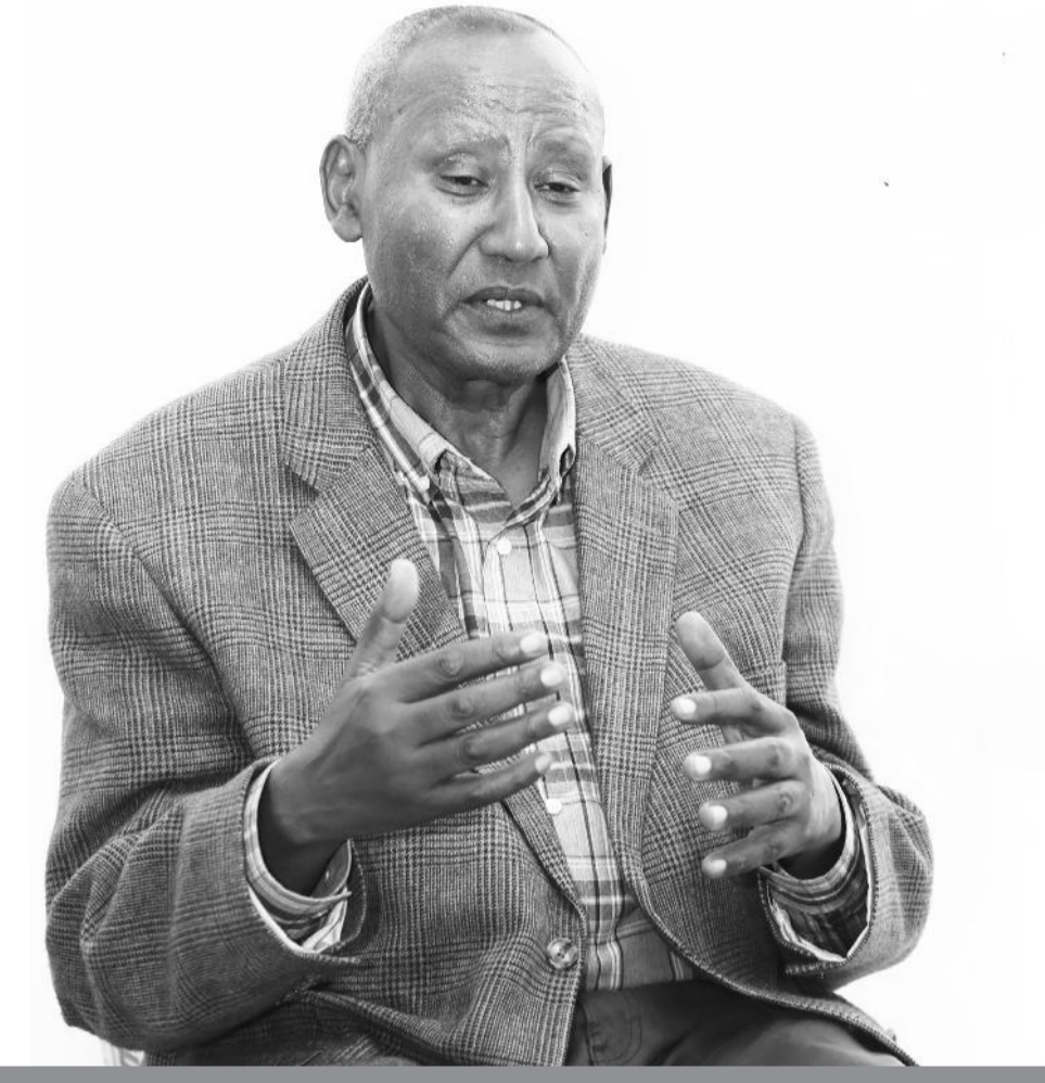
ዶ/ር የሚገመት መሳሪያ ከአሜሪካ ስለምትወስድ ግብጽን ሙሉ በሙሉ ሊያገልጹት አይችሉም ባይ ነኝ።

በእኔ ግምት አሁንም ድረስ ግብጽ ከአረብ አገሮች መካከል ተጽዕኖ ፈጣሪ ስለሆነች አስፈላጊያቸው እና ከሁለት እስከ ሶስት ቢሊዮን