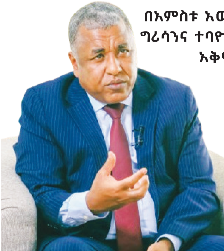
ፎቶ ሀዳሽ ሕብረጊ