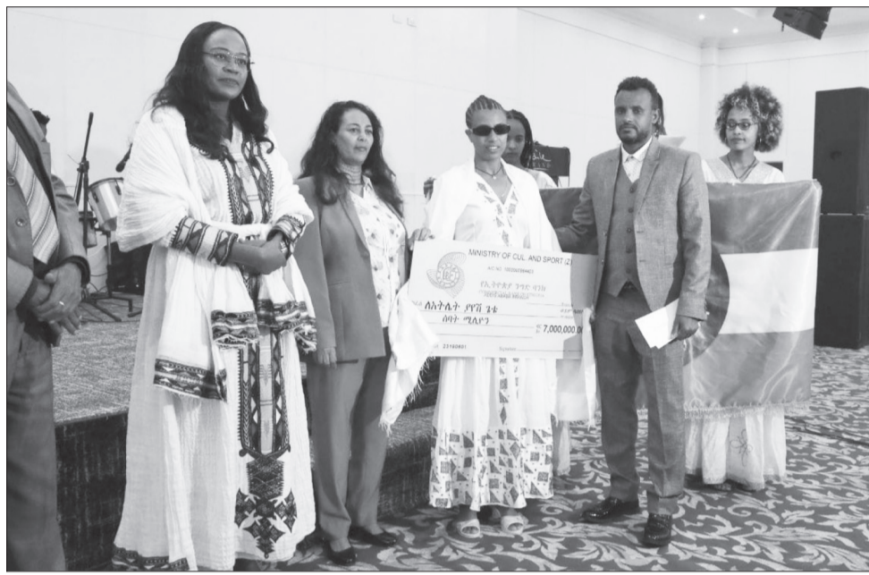
የዓለም ክብረውን በማሻሻል የወርቅ ሜዳሊያ ያጠለቀው አትሌት ያየሽ ጌቱ የ7 ሚሊዮን ብርና የ50 ግራም ወርቅ ተሸላሚ ሆኑት።

የሽልማት መርህ ግብሩን ተከትሎ ንግግር ያደረጉት የአፌራሪ ባህልና ስፖርት ሚኒስትሩ ሸዌት ሻንካ፣