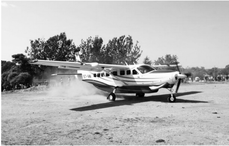
ኤርፖርትነት የሚያደጉ ናቸው። ይህም መዳረሻዎቹን በተለይም ለኢትዮጵያ ከፍተኛ ጠቀሜታ እንዲኖራቸው ያስችላል።