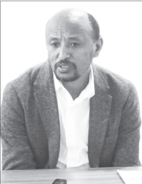
ሸቶ ኢሳይያስ ሰማ