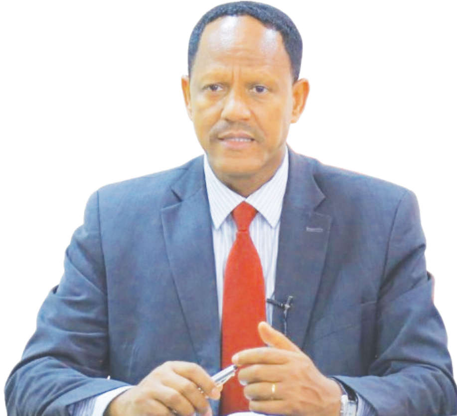
ልዩነት ፣ ያለምንም ጣልቃ ገብነት እንዲሁም ያለምንም በመፍጠር ጥራት ያለው፤ ቀልጣፋ አገልግሎት የሚሰጥ ማድረግ ነው ያሉት ነገሪ (ዶ/ር)፤ ይህም የተገልጋዩን ሕዝብ የአዋጁም ዓላማ ነጻና ገለልተኛ የሆነ ሲቪል ሰርቪስ «አዋጁ በብቃትና ... ወደ ገጽ 4 ዞሯል

ነጻ እና ገለልተኛ ሲቪል ሰርቪስ ማለት አንድ ሰው የፖለቲካ ፓርቲ አባል ስለሆነ የፈለገውን ያደርጋል ማለት አለመሆኑን የሚያሳውቅ፤ በሃይማኖት እንዲሁም በዝምድና እና ሌላ ሰው በመሀል ገብቶ ተጽዕኖ እንዳይፈጥር የሚከላከል፤ የኢትዮጵያን ሕዝብ ያለምንም