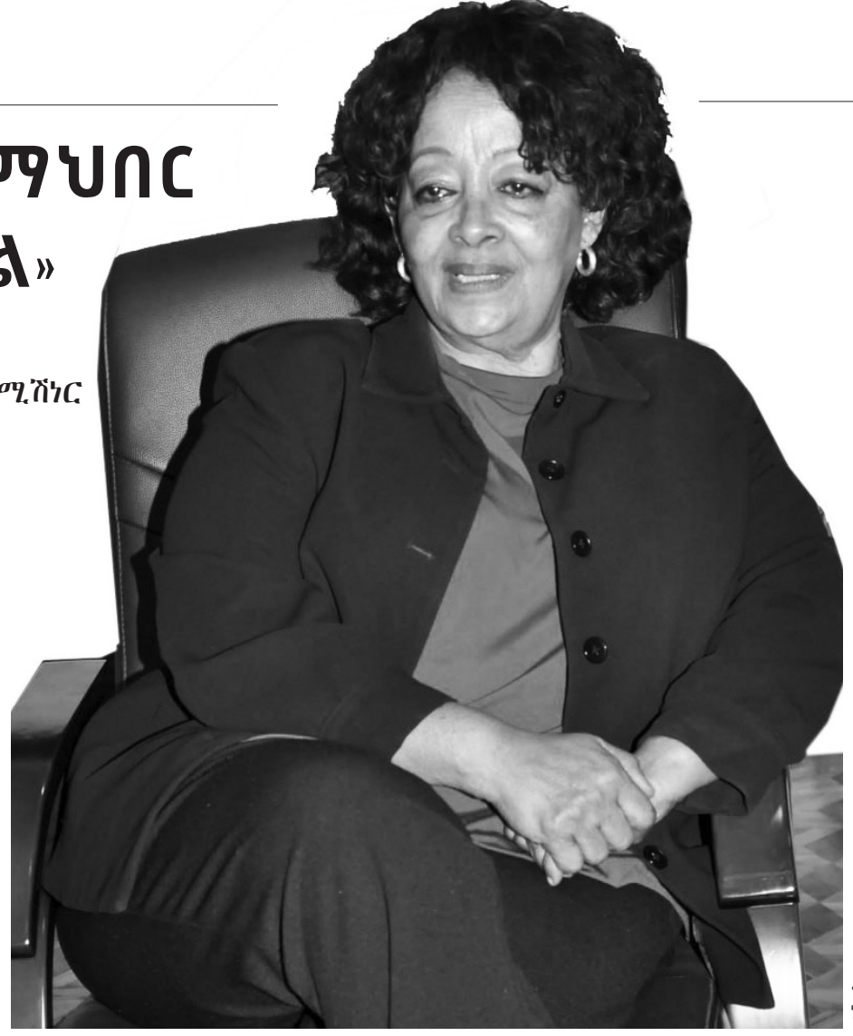
ጌታ፡፡አዮ ብ ተፈሪ