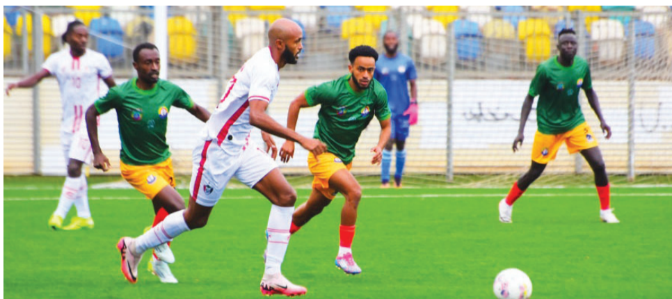
ዋልዎቹ በቻን ስመሳተፍ ዛሬ ሱዳንን ቢያንስ 300 ማሸነፍ አስባቸው።

በሀገር ውስጥ ሊገኙ በሚሰጡት ተጫዋቾች ብቻ የሚካሄደው የአፍሪካ ሀገራት ዋንጫ (ቻን) ከሁለት ወራት በኋላ በምስራቅ አፍሪካውያን ሀገራት አዘጋጅነት ይካሄዳል። የጋንዳ፣ ታንዛኒያ እና ኪንያ በጥምረት ለ8ኛ ጊዜ በሚያደርጉት በዚህ ውድድር ላይም 19 ሀገራት ተሳታፊ ናቸው። ከእነዚህ ሀገራት መካከል ለመሆንም ሀገራት የሚጣሪያ ጨዋታዎቻቸውን በማከናወን ላይ ይገኛሉ።