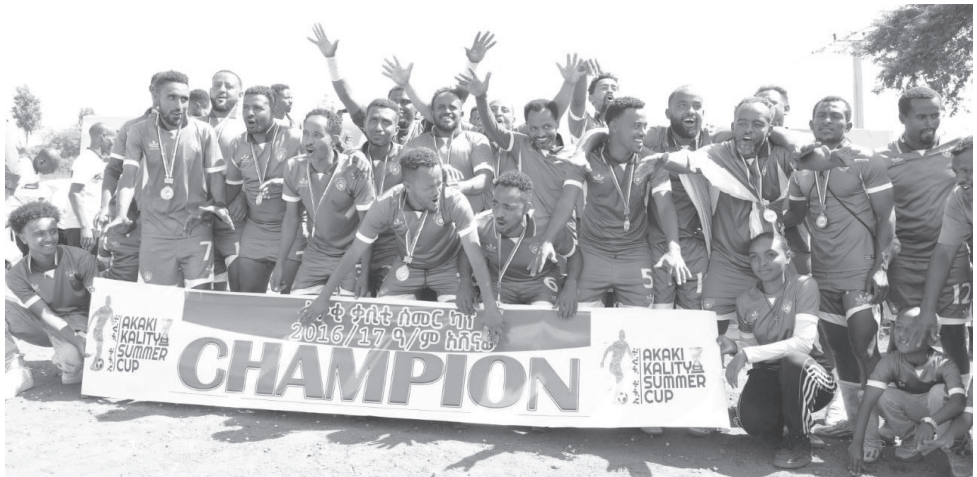
አቃቂ ወንድማማቾች ጤና ስፖርት ማህበር።

አድሜያቸው ከ30 ዓመት በላይ የሆኑ 20 ቡድኖችና አድሜያቸው ከ40 ዓመት በላይ የሆኑ 8 ቡድኖች በውድድሩ ተሳታፊ ሆነዋል። እነዚህ ቡድኖች በአምስት ወራት የዙር ውድድር በሰበሰቡት ነጥብ መሠረት አሸናፊው ታወቋል። ከ30 ዓመት በላይ ውድድር የፍጻሜ ጨዋታ አቃቂ ወንድማማቾች ጤና