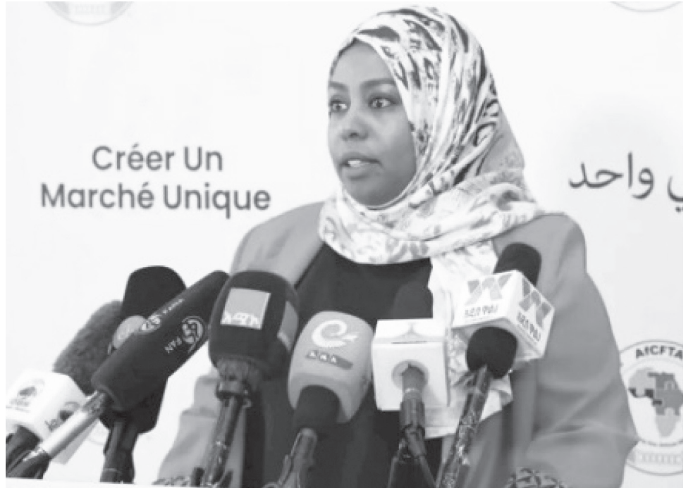
መጋቢት 21 ቀን 2018 በሩዋንዳ ኪጋሊ በተካሄደ የአፍሪካ ተግባራዊ ሆኗል፤ እ.ኤ.አ. ከጥር 1 ቀን 2021 ጀምሮ ንግድ ሀገራት የመሪዎች ጉባኤ ተፈርሞ በሚያዘያ 30 ቀን 2019 እንዲጀመር ስምምነት ላይ ተደርጏል።

ጉባኤው ለተከታታይ ሦስት ቀናት የሚቆይ ሲሆን አንድ የአፍሪካ ገበያን የመፍጠር እሳቤ ያገኘ ስለመሆኑም ተጠቁሟል። የአፍሪካ አሕጉራዊ ነፃ የንግድ ቀጣና ስምምነት እ.ኤ.አ