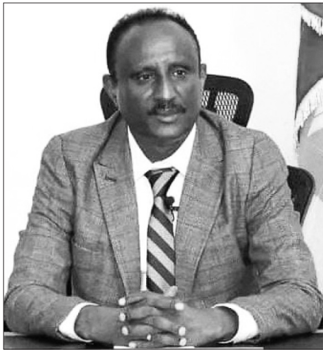
ሻሰቃ ዘርዘን ተፈሪ