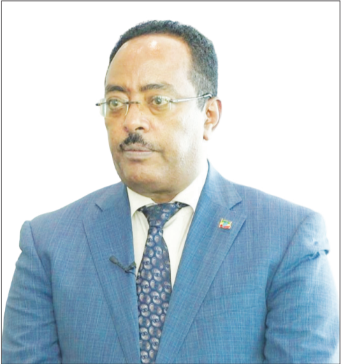
አምባሳደር ራድዋን ሁሴን