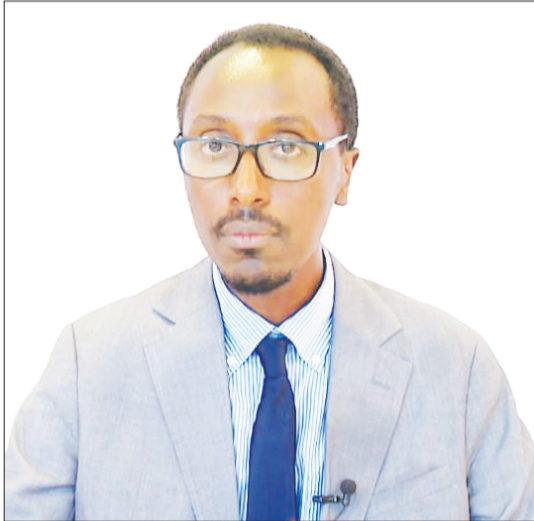
“በብሪቲሽ ማሕቀፍ ... ወደ ገጽ 4 ዞሯል ፕሮጀክት ጠቅላይ ሚኒስትር (ዶ/ር)

በፋይናንስ ካህን 16ኛው የብሪቲሽ ጉባዔ ላይ ሰፊ የሉ ጉዳዮች ተዳሰውበታል። ኢትዮጵያም ተጠቃሚነቷን ለማስፋት በጠቅላይ ሚኒስትር ዐቢይ አሕመድ (ዶ/ር) በተመራ ልዩነት ተወካዎች ነበር። ባለፈው ዓመት በተካሄደው ጉባዔ ኢትዮጵያን ጨምሮ ስድስት ሀገራት ብሪቲሽን መቀላቀላቸው ይታወቃል። ብሪቲሽ ኢትዮጵያን ጨምሮ ስምምነት የሚደርሱ የሀገራት ስብስብ ነው። በዚህ ውስጥ የዓለማችን 45 በመቶ የሕዝብ ብዛት እና 35 በመቶ የዓለምን ኢኮኖሚ የያዙ ሀገራትን አስባስቧል። ብሪቲሽ በተለያዩ የትኩረት መስኮች ላይ ትብብር የሚያደርግና የጋራ አድምዎ የሚያዘበት በመሆኑ ኢትዮጵያ የዚህ አባል መሆኗ ብሔራዊ ጥቅሟን ለማስጠበቅ አይነተኛ መንገድ ከፍተኛነት አለታት።