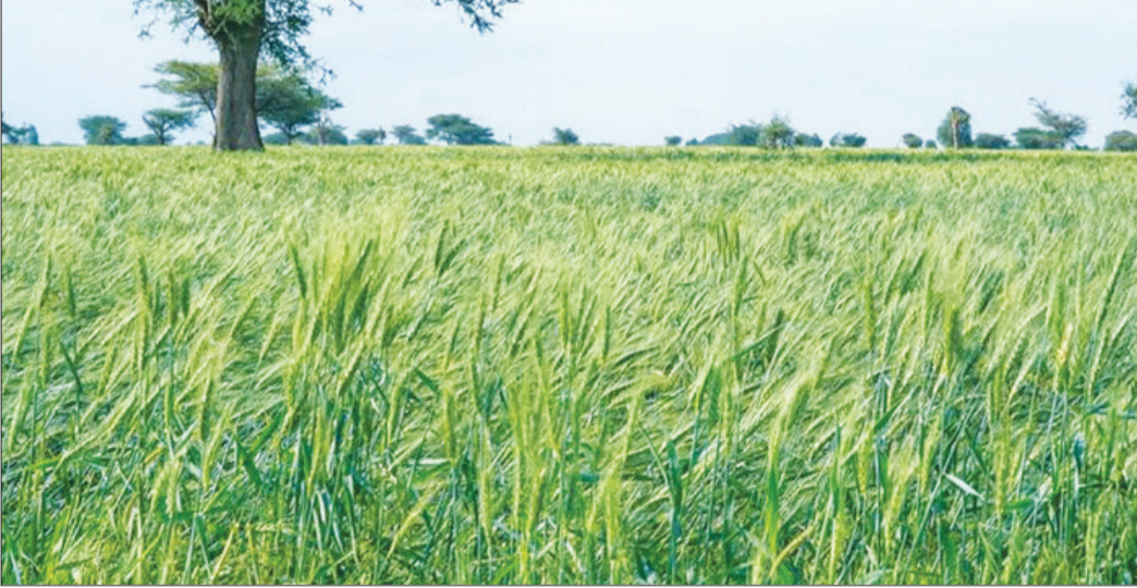
በበጋ የሰንዳ መስና 172 ሚሊዮን... ወደ ገጽ 11 ዞሯል

ታደህ ብናልፈው አዲስ አበባ፡- በ2017 ዓ.ም በሁሉም ክልሎች የበጋ ሰንዳ መስና ልማት በማልማት 172 ሚሊዮን ኩንታል ምርት ለማግኘት ታቅዶ እየተሠራ መሆኑን የግብርና ሚኒስቴር አስታወቀ። የግብርና ሚኒስቴር የሕዝብ ግኑኝነትና ኮሙኒኬሽን ሥራ አስፈጻሚ አቶ ከበደ ላቀው ለኢትዮጵያ ፕሬስ ድርጅት እንደገለጹት፤ 2017 ዓ.ም በሁሉም ክልሎች የበጋ ሰንዳ መስና ልማት በማልማት 172 ሚሊዮን ኩንታል ምርት ለማግኘት ታቅዶ እየተሠራ ነው። በ2017 ዓ.ም የበጋ ሰንዳ መስና ልማት በአራት ነጥብ ሁለት ሚሊዮን ሄክታር መሬት ላይ በማልማት 172 ሚሊዮን ኩንታል ምርት ለማግኘት ሰፊ እንቅስቃሴ