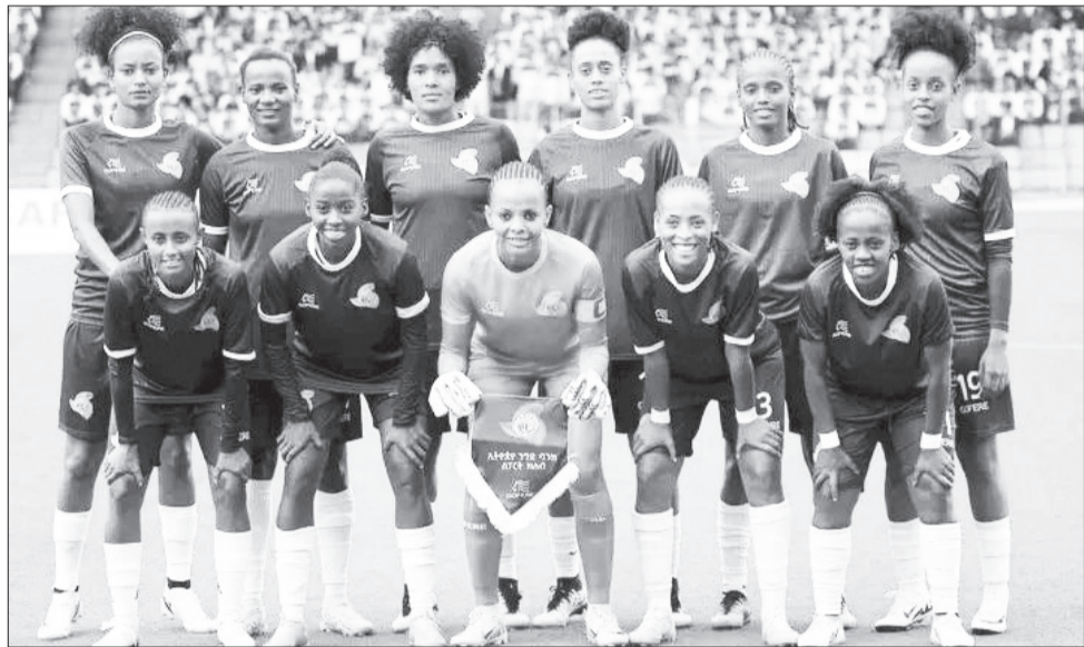
ኢትዮጵያ ንግድ ባንክ በካፍ የሴቶች ቻምፒዮንስ ሊግ የመጀመሪያ ጨዋታውን ያደርጋል።

ስምንቱ ክለቦች በሁለት ምድቦች ተከፍለው በሚያካሂዱት አህጉራዊ ውድድር ንግድ ባንክ የመጀመሪያውን የምድብ ማጣሪያ ጨዋታውን ነገ ምሽት 2 ሰዓት ከናይጄሪያው ኤድ ኩዊንስ ክለብ በማድረግ ይጀምራል። በምድብ ሁለት ከጠንካራ የአህጉራቱ ክለቦች የተደለደለው ንግድ ባንክ ከናይጄሪያው ክለብ ጋር