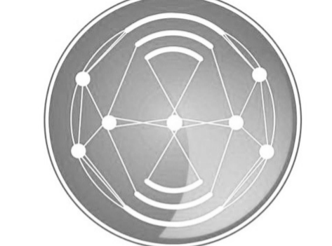
በኢ.ፌ.ዴ.ሪ የመንግሥት ኮሙኒኬሽን አገልግሎት FDRE Government Communication Service

በግብርናው ዘርፍም ቴክኖሎጂና ሌሎች ዘመኑን የዋጁ ግብዓቶችን መጠቀም መጀመራችን ይበልጥ መደላድልን ፈጥሯል። ለዚህ አመቺ መደላድል ለመፍጠርም የግብርና ቴክኖሎጂዎች ከቀረጥ ነፃ የሚገቡበት የሕግ ማሻሻያ በለውጡ ማግሥት ተደርጓል ብሏል።