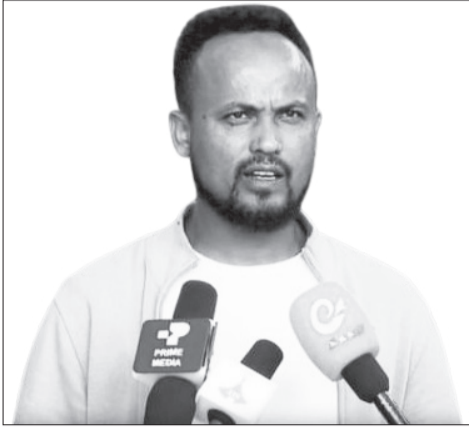
ስቶ ኤሊያስ ከደር