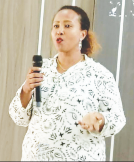
የገዘፈ፣ በማንነቷ ጎልቶ የተጻፈ ታሪክ ነው።

ሕይወት ይህን እውነት ካወቀች ወዲህ «ካንሰር» ይሉትን ቃል ስትፈራው፤ ስትጠላው ኖራለች። ይህ ሕመም እናቷን ከእሷ ነጥሎ ወስዷል። እህት ወንድሞቿን አሳቆ፤ በናፍቆት፤ አራቁቷል። እሷ በእናትና ልጅ መሀል የሰላ መቀስ ስለሆነው ካንሰር ያላት ምስል በዓዕምሮዋ