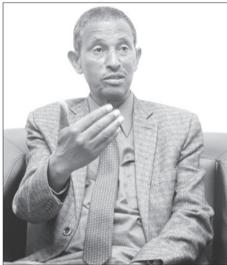
ጌታ - አዲስ ተፈሪ

መንግሥት ከአምስት ዓመት በኋላ ውድድሩን ለማዘጋጀት ቁርጠኝነቱን ከማሳየት በተጨማሪ፣ ዝርዝር የሰራ አቅድ ያዘጋጃል የሚል ተስፋ እንዳላቸው ኢንስትራክተር ሰለሞን ይናገራሉ። ለዚህም ብዙ ባለሙያዎችን አቅፎ የሚንቀሳቀስ ብሔራዊ የአምስት ዓመት ስልታዊ እቅድ ማዘጋጀት አለበት ይላሉ። ይህም ከወዲሁ አቅዶችን በማውጣት በዛ መሰረት መስራት የሚቻል ከሆነ ውድድሩን የማስተናገድ እድሉን ማሳካት ይቻላል ባይ ናቸው።