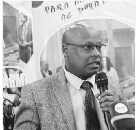
ሸቶ ስብዱ ሙሙድ