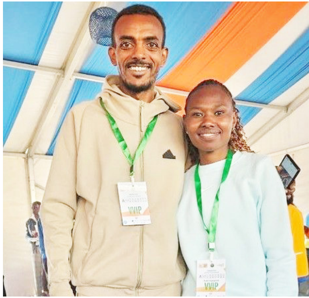
የማራቶን ስሊምፒክ ቻምፒዮን ታምራት ቶላና የማራቶን ባስክብረወሰና ሩት ቼፕገንቴት የታላቁ ሩጫ በኢትዮጵያ የክብር እንግዳ ነበረ።

የ2024 የፓሪስ አሊምፒክ ማራቶን አሸናፊው አትሌት ታምራት ቶላ፣ በ2008 ዓ.ም በታላቁ ሩጫ በኢትዮጵያ ውድድር ላይ የተሳተፈ አትሌት ነበር። ውድድሩ በአሁኑ ወቅት ማደጉን እና የተሻለ ደረጃ ላይ መድረሱን የተናገረው ታምራት፣ በመድረኩ የሚያሸንፉ አትሌቶች በአሊምፒክና ዓለም