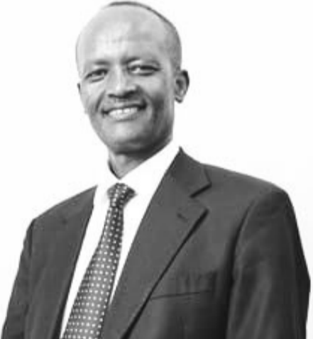
በቂ የኤሌክትሪክ ሃይል እና በቂ ውሃ የሚጠይቁ ናቸው ብለዋል።

አሁን እንደሀገር የያዘናቸው የልማት አቅዶች እውን ሊሆኑ የሚችሉት ውሃን ብቻ ሳይሆን ከውሃ የሚገኘውንም የኤሌክትሪክ ሃይል በአግባቡ በማልማት መጠቀም ሲቻል ነው ያሉት ተመራማሪው። ዛሬ በስፋት እየተሰሩ ያሉ ከተሞችን የማዘመን ሥራዎችም ቢሆኑ