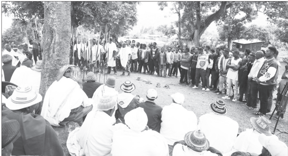
የዱቡቫ ሥርዓት ሲካሄድ

“አፊኒ” ሲባል ነገሩ ከመክረር ይልቅ ለውይይት ክፍት ይሆናል። ተናዶ የመጣ አካል “አፊኒ” ሲባል ከንዴቱ በተወሰነ ደረጃ ሰከን የማለት እድል ያገኛል። በአፊኒ የሚገኘው የከረረ ግጭት ብቻ አይደለም። አባቱ ትክክል አይደለም በድሎኛል ያለ ልጅ ለአባቱ እኩያ አፊኒ ሲል ነገሩን ያስረዳል። በአባቱ ተበድያለሁ የሚልን ሕጻን ሀሳብ ሳይንቁ የሚሰሙት አባቶች ለመፍትሄ አባትን ያናግራሉ። በተመሳሳይ ልጅ አጥፍቷልና ቅጣት ያሻዋል ያለ አባት ልጁ ላይ እጁን ከመሰንዘሩ በፊት አፊኒን ያስቀድማል። በባሕሉ ሳያስበው ቡጢ የተሰነዘረበት ሰው ቢኖር እንኳን ቡጢውን መመለስ ቢፈልግ መጀመሪያ “አፊኒ” ማለት አለበት። ይህ ሳይሆን ቢቀርና የተሰነዘረበትን ቡጢ ልመልስ ብሎ ቢሰነዘር ጥፋቱ ከመጀመሪያው ተማቹ ይልቅ በሁለተኛው ላይ ያይላል። ስለዚህም አፊኒ አላልከም በሚል ተመቺው ከተቀጣ በኋላ የመጀመሪያው ተመቺ “ለምን መታሃው?” ተብሎ ይጠየቃል። ግጭትን