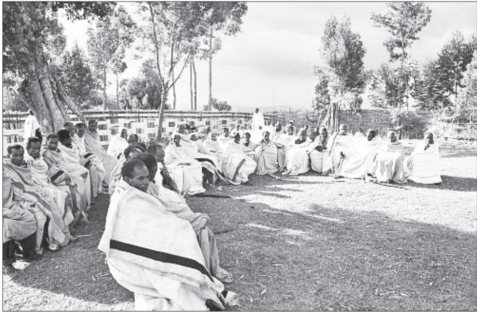
የአፊኒ ሥርዓት ሲካሄድ

ማስቀረት ባይቻልም አፊኒ የምትለዋ ቃል ሰዎች ከገቡበት ግጭት የምታቀዘቅዝና ነገሩን በብልሃት የሚያመዘክኑበት አቅም ይሰጣቸዋል።