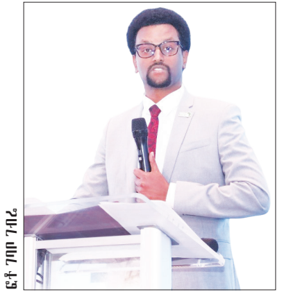
ፎቶ ገበየ ገብረ