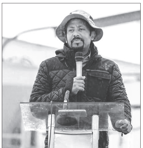
ጠቅላይ ሚኒስትር ዐቢይ አሕመድ (ዶ/ር)

ሚኒራልስ ኩባንያ መጋቢ ሲሆን፣ በስካንዲኔቪያን ሀገራት መሀረቱን ያደረገ በኢትዮጵያ ኢንቨስትመንት ሆልዲንግስ በኩል ከኢትዮጵያ መንግሥት ጋር በወርቅ ፍላጋ እና ማውጣት ስራ ላይ የተሰማራ ኩባንያ ነው።