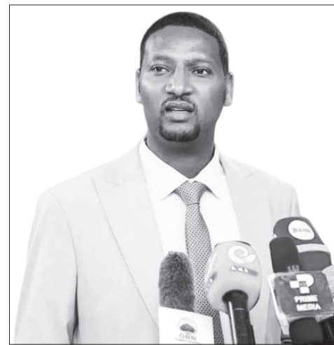
ሰላም አማራጮች የተመለሱትን ተቀብሎ ሥልጠና በመስጠት የሚያቋቁማቸው መሆኑን ገልጸዋል።

የሽብርተኛው ሽንጭ አላሳት ሕዝብ ያቀረበውን ጥሪ ተቀብለው ወደ ሰላም እየተመለሱ እንደሚገኝ በመግለጽ፣ መንግሥት የሕዝቡን ጥሪ ተቀብሎ ወደ