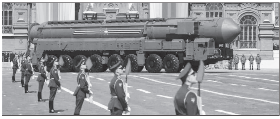
ሩሲያ ስሕገር ስቋራጭ ሚሳላላን በወታደራዊ ትርዒት ላይ ባቀረቡበት ጊዜ