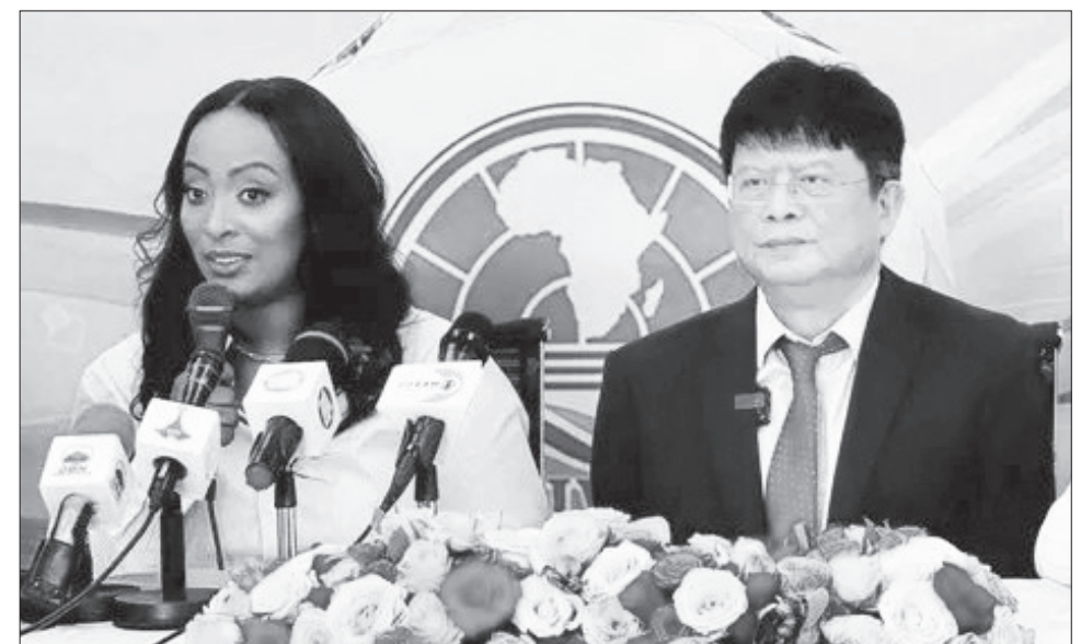
ሁለት አሸናፊዎች እያንዳንዳቸው 10 ሚሊዮን ብር ሽልማት ይበረክታላቸዋል

በተጨማሪ የሰላም ሽልማት ዘርፍ ደግሞ በአኗኗሩ ሰላምን ከፍ የሚያደርግ፣ ዋጋ ከፍሎ በህብረተሰብ መካከል እርቅን ለማውረድ የሠራ፣ ይቅርታን እየኖረ ይቅርታን የሰበከ፣ የጋራ አኩላትን ያበሰረና የታወቁ ጥቃትን የሚፀየፍ የእጩ ዝርዝር ውስጥ መካከት