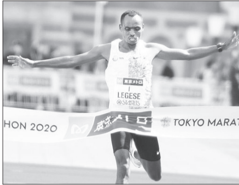
ስትሌት ብርሃን ሰገሰ፤

ከዓለም ዋና ዋና ከሚባሉት ስድስቱ የማራቶን ውድድሮች መካከል አንዱ የሆነው የቼካኅ ማራቶን ከነገ በስተቀር ይካሄዳል። መነሻውን በግራንት ፓርክ በማድረግ በታላላቆቹ የቼካኅ ከተማ ጎዳናዎች ላይ የሚካሄደው ውድድር ዘንድ ለ46ኛ ጊዜ ሲካሄድ 50 ሺ የሚሆኑ ተሳታፊዎች እንደሚሮጡ ታውቋል። ከአዝዳቤው ሩጫ ባለፈ አንጻር የሆነው የታዋቂ አትሌቶች ፍልሚያም የኢትዮጵያ እና ኬንያ የማራቶን ከዋክብት አትሌቶችን ያገናኛል።