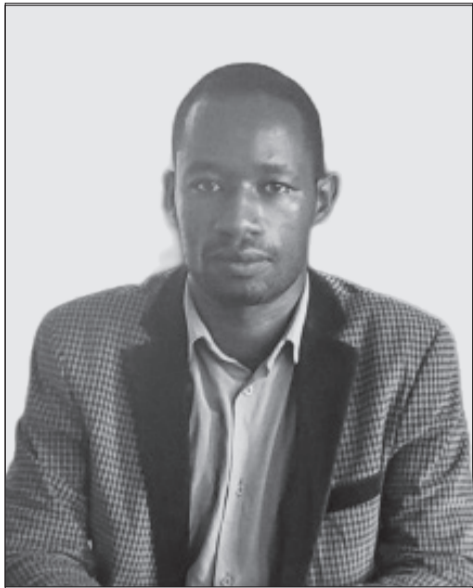
ሸቶ ስነሱ ሐልቻዬ