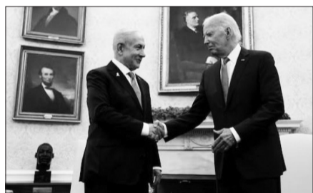
የእስራኤል ጠቅላይ ሚኒስትር ኔታንያሁ እና የአሜሪካው ፕሬዚዳንት ባይደን

ፕሬዚዳንት ባይደን ባለፈው ሳምንት እስራኤል የኢራን የገዳጅ እና የኒዩክሌር ጣቢያዎች እንዳታጠቃ ጥሪ ማቅረባቸው ቢነገርም ቴል አቪቭ የቴህራንን የኒዩክሌር ጣቢያዎች ዓላማ ልታደርግ እንደምትችል ይጠበቃል።