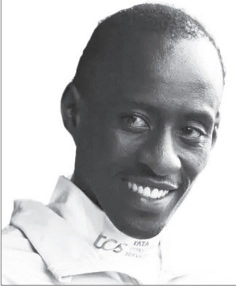
የዓለም የማራቶን ክብረውን ባለቤቱ ኬልቪን ኪፕቱም።