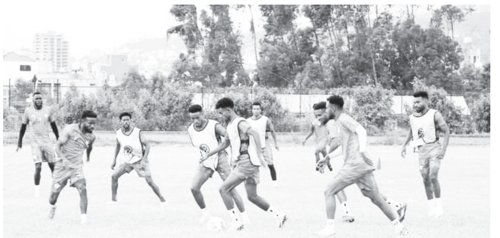
ዋልያዎቹ 3ኛውን የአፍሪካ ዋንጫ የምድብ ማጣሪያ ጨዋታ ዛሬ ጊኒን አቢጃን አሳሳኒ ስቴዲየም ይገጥማሉ።