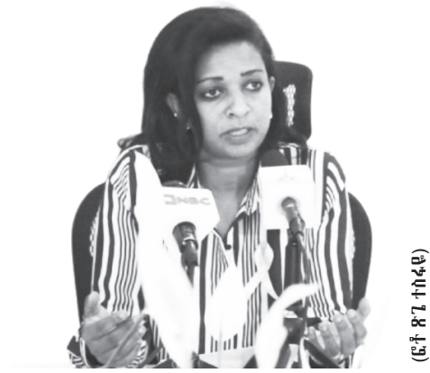
ዶክተር ሕይወት ሰዎች

በዓለም ላይ በገዳይነታቸው ከሚታወቁ ተላላፊ ያልሆኑ በሽታዎች አንዱ ካንሰር ነው። ከካንሰር አይነቶች በተለይም የጤት ካንሰር የሴቶችን ሕይወት ከመንጠቅ አንጻር ከሌሎች ሕመሞች ሁሉ የከፋ እንደሆነ መረጃዎች ያሳያሉ። ይህን ከጊዜ ወደ ጊዜ እየተስፋፋ የመጣውን የጤት ካንሰር ለመከላከል ዓለምአቀፍ የጤና ድርጅት (WHO) የተለያዩ ፕሮግራሞችን ቀርጾ ወደ መሬት በማውረድ ሕመሙ በሰዎች ላይ በተለይም በሴቶች ላይ የሚያሳድረውን ተፅዕኖ ለመግታት ከዓመት እስከ ዓመት በርካታ ተግባራትን እያከናወነ ይገኛል። በተለየ ሁኔታ ደግሞ መላው የዓለም ሕዝብ ስለሕመሙ ግንዛቤ እንዲጨብጥና እራሱን ለጤት ካንሰር ሕመም አሳልፎ እንዳይሰጥ በዓመት አንድ ጊዜ በወር ለ ጥቅምት የግንዛቤ ማስጨበጫ ጎቅናቄ ይደረጋል።