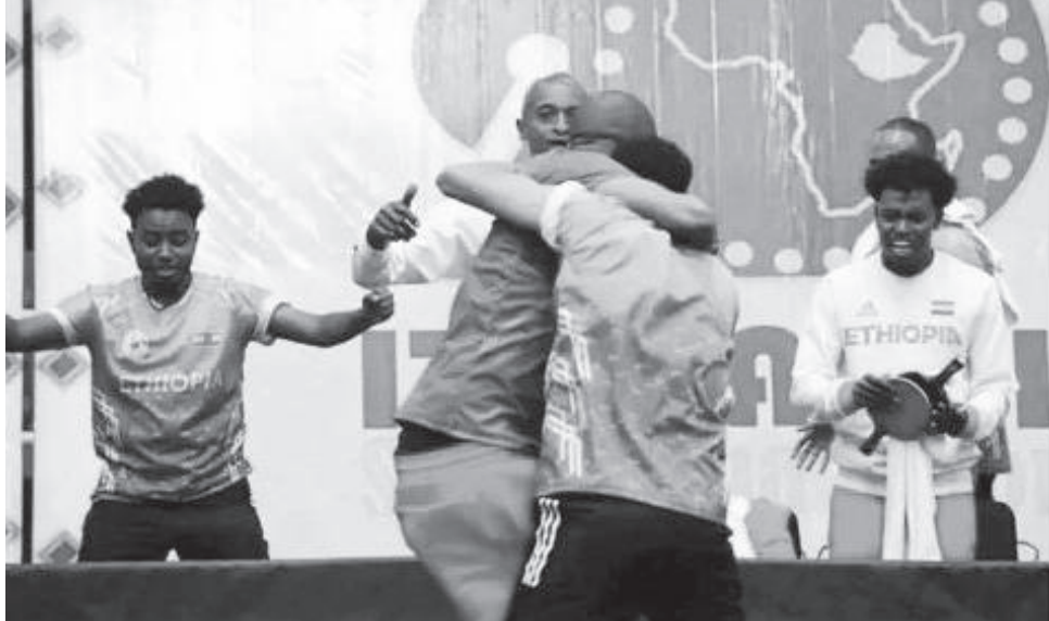
በአፍሪካ ጠረጴዛ ቴኒስ ሻምፒዮና ኢትዮጵያ በቡድን ወንዶች ውድድር 4ኛ ሆና በማጠናቀቅ የነሐስ ሜዳሊያ ወሰዳለች።

በኢትዮጵያ የክለሲካ ሻምፒዮና እንዲሁም ከሌሎች ሀገር አቀፍ ውድድሮች የተመረጡት ተጫዋቾችም ለዚህ