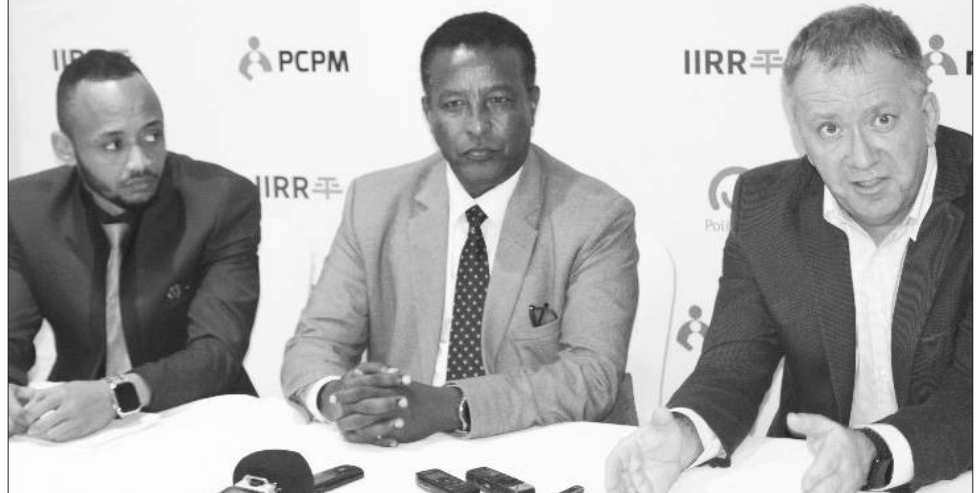
ፕሮጀክቱ በሁለት ዓመታት ተገባራዊ ይደረጋል

ለኢትዮጵያውያን ድንገተኛ የሕክምና ቡድን አባላት የአቅም ማሳደግ ድጋፍ እያደረገ መሆኑን ጠቅሰው፤ ማዕከሉ በኢትዮጵያ በነበረው የ12 ዓመታት ቆይታ ከአራት ነጥብ አራት ሚሊዮን ዶላር በላይ ወጪ በማድረግ በትምህርት፣ በጤናና በሌሎችም ዘርፎች 10 ፕሮጀክቶችን አጠናቆ ወደትግበራ ማስገባት መቻሉን ጠቁመዋል።