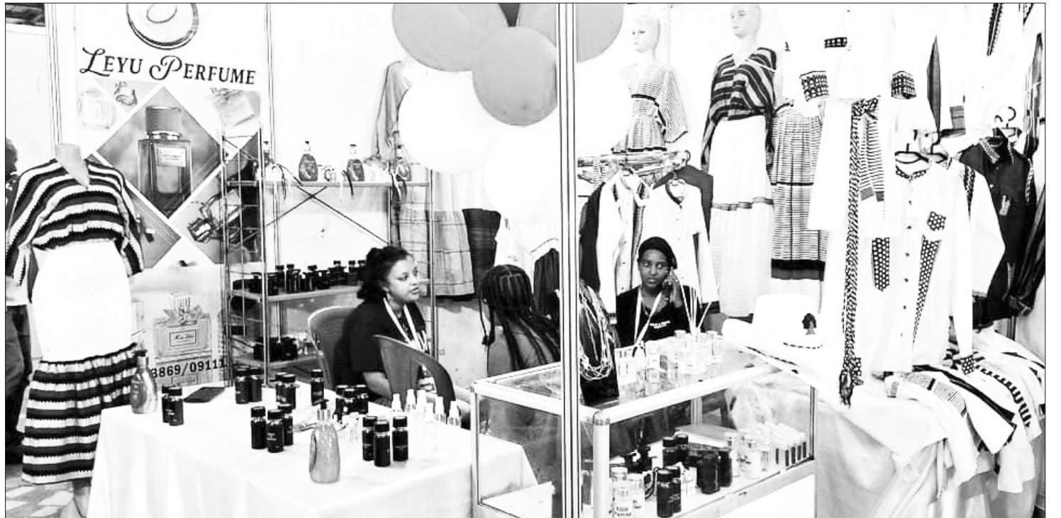
የኤክስፖርት ተሳታፊዎች ይዘው ከቀረባቸው መካከል የአረብ ብሔረሰብ ባሕላዊ አልባሳት ይጠቀሳሉ።

ከማህበራዊ ጠቀሜታው ባለፈም ከዓመት ዓመት እየሰፋና እየደመቀ የመጣው የእጅግ በዓል አከባቢ ኢኮኖሚያዊ ፋይዳውም ከፍተኛ እየሆነ መጥቷል። የእጅግ በዓል መገለጫ የሆኑና በዓሉን ያደምቃሉ የተባሉ የማህበረሰቡ ባሕላዊ ምግቦች፣ ቁሳቁሶች አልባሳት በዚህ ወቅት በስፋት ወደ ገበያ ይወጣሉ። ይህም ለኢኮኖሚው የሚኖረው አበርክቶ ጉልህ ነው። ባሕላዊ አልባሳቱን፣ ጌጣጌጦቹንና ባሕላዊ ምግቦቹን ከማስተዋወቅ ባለፈ በመሸጥ ለሚተዳደሩ ሰዎች አንድ የንግድ/ ቢዝነስ/ አማራጭ ሆኖ እያገለገለ ነው። ለበርካቶች የሥራ ዕድል እየፈጠረም ይገኛል። በተለይም ዘንድሮ የሚከበረው የእጅግ በዓል “እጅግ ኤክስፖርት 2017” በሚል ለመጀመሪያ ጊዜ ኤግዚ.ቪ.ቪንና ባዘር መዘጋጀቱ በዓሉን ልዩ ያደርገዋል።