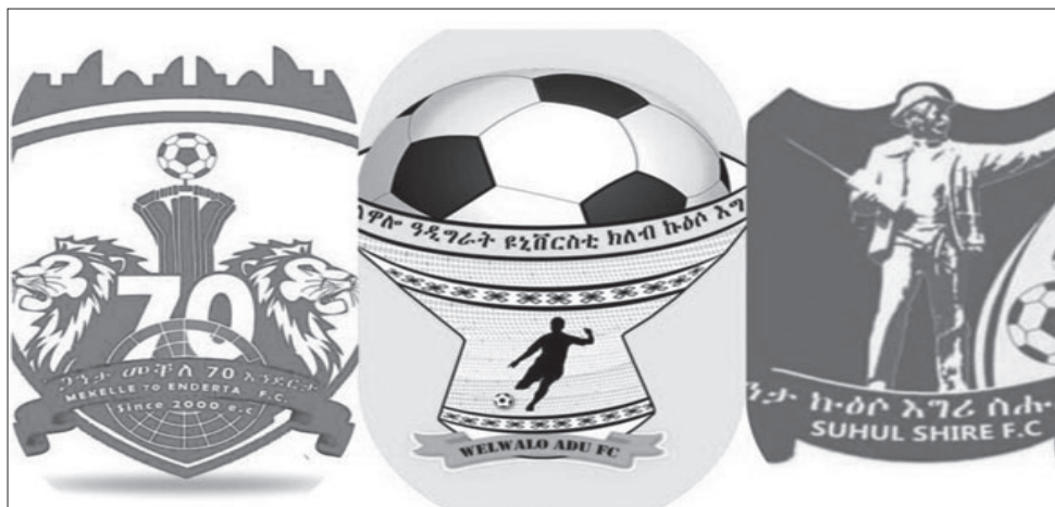
በ2017 ወደ ኢትዮጵያ ፕሪሚየር ሊግ የተመለሱት ሶስት የትግራይ ክለቦች ኳስ ክለቦች፡

ክለቦቹ ለአራት ዓመት ከልምምድና ከውድድር ርቀው እንደመቆየታቸው፤ የውድድሩን ጫና መቋቋም ይከብዳቸዋል የሚል ስጋት የነበረ ቢሆንም አጀማመራቸው ከተጠበቀው በላይ መልካም የሚባል ሆኗል። ክለቦቹ በክልሉ ከነበረው ችግር አንጻር በአጭር ጊዜ በመደራጀት ለውድድር መብታቸው አራሱ የሚበረታታ የሚደነቅ ነው። ከአገር ኳስ ለአንድ እና ሁለት ወራት መራቅ እንኳን ዋጋ በሚያስከፍልበት በዚህ ዘመን ችግሮችን ተቋቋሞ ወደ ውድድር መመለስ ሌሎቹ ክለቦች ለማሳተፍ የሚገባውን ትልቅ ማሳያም ጭምር ነው። ከሁሉም በላይ እንደ አዲስ በመተግበር ላይ የሚገኘውን የክለቦች ፍቃድ አሰጣጥንም በማሟላት ለውድድሩ መብታት እንዲሁ ለአንዳንድ ክለቦች አራሳቸውን