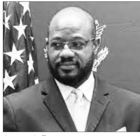
አምባሳደር አርቲስት ማህበረ

ኮሚሽኑ እስካሁን በቤኔሻንጉል ጉሙዝ፣ በጋምቤላ፣ በሐረሪ፣ በሲዳሞ እና በማዕከላዊ ኢትዮጵያ ክልሎች እንዲሁም በአዲስ አበባ ከተማ እና በድራዳዋ ከተማ አስተዳደሮች የአጀንዳ ማሰባሰብ መድረኮችን አካሂዷል።