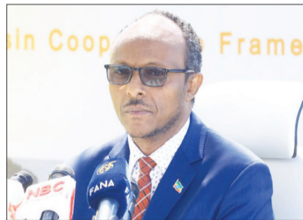
ፊት፡ ሐዲሽ ስብርሃ