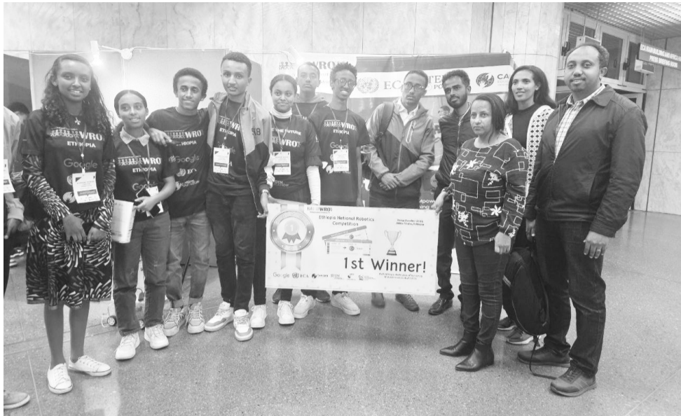
የኮተቤው ስቲም ፓውር ማዕከል በቱርክ ውድድር ለመሳተፍ አሸናፊ ሆኗል

«ኢትዮጵያ በዚህ ውድድር የምትሳተፈው ለመጀመሪያ ጊዜ ነው፤ እንድትመረጥ ካደረጓት ምክንያቶች መካከል እንደ ሀገር ሳይንስ፣ ቴክኖሎጂ፣ ኢንጂነሪንግና ሂሳብ ትምህርት ዙሪያ ስቲም ፓውር ባከናወነው ተግባር ነው። ድርጅቱ ኢትዮጵያ ውስጥ በእነዚህ መስኮች መሥራት ከጀመረ 15 ዓመታትን አሸቆጥሯል። በእ.ኤ.አ 2020 ጀምሮ ለሌሎች ሀገራት የእኛ ሀገር ተሞክሮ ማጋራት ጀምረናል። ደቡብ ሱዳን፣ ሩዋንዳ የመሳሰሉ 33 የአፍሪካ ሀገራት አድርገናል። ስቲም ፓውር ሮቦቲክ ላይ ኢትዮጵያ ውስጥ መሥራት ከጀመረ ስምንት ዓመታት ተቆጥረዋል። የሮቦቲክ ወደ ዓለም አቀፍ መድረክ ለማድረስ ግን እድሉ አልነበረም። ይህም የሆነበት አቅም ሳይኖር ቀርቶ ሳይሆን የፋይናንስና የሎጂስቲክ የመሳሰሉ ችግሮች ስለነበሩ ነው። አሁን ከዓለም አቀፍ ተቋማት የገንዘብ ድጋፍ ስለተደረገ