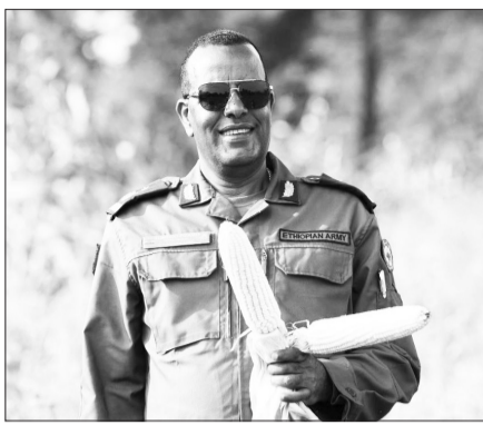
በርጋዲስ ጄኔራል ጠ-ምሲዶ ፊታሞ