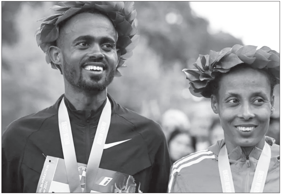
የበርሊን ማራቶን አሸናፊዎቹ ሚልኬሳ መንገሻ እና ትዕግስት ከተማ።

በወንዶቹ መካከል በተካሄደው ውድድር አትሌት ሚልኬሳ መንገሻ አሸናፊ ሲሆን ፋክክሩን ያተናቀቀበት ሰዓትም 2:03:17 ሆኖ ተመዝግቧል። ይህም ለአትሌቱ የርቀቱ የጣሉ ፈጣን ነው። ከመም ውድድር እኦኦ በ2022 ወደ ጎዳና ላይ ሩጫዎች የገባው ሚልኬሳ ባለፈው ዓመት በዴጉ ማራቶን አሸናፊ በመሆን ነበር ያጠናቀቀው። በዓለም አትሌቲክስ ቻምፒዮናም 6ኛ ደረጃን በመያዝ ነበር የፈጸመው። በተያዘው ዓመት