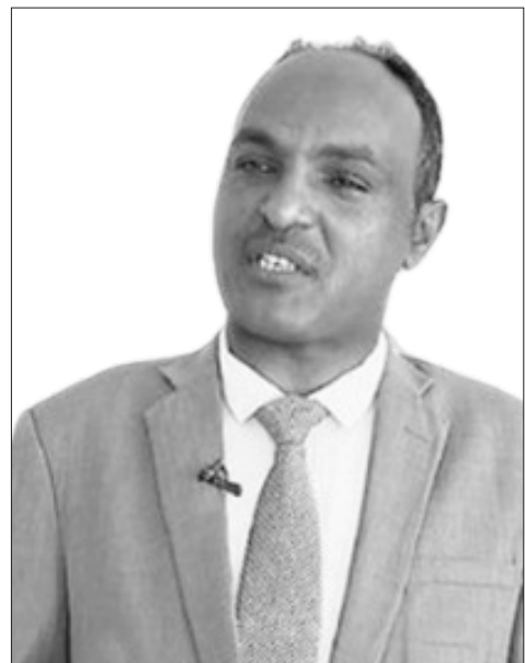
አቶ ሰይህን ሰብሳቢ

ዩ ኤን ዲ ፒ ኢትዮጵያ የአየር ንብረት ለውጥን በመከላከል አረንጓዴ ልማትን ለመገንባት የያዘችውን ዕቅድ እውን ለማድረግ ዓለም አቀፍ ተቋማትን በማስተባበር ድጋፋቸውን እንደሚቀጥሉ አረጋግጠዋል።