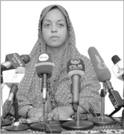
አምባሳደር አይሮሪት መሐመድ (ዶ/ር)