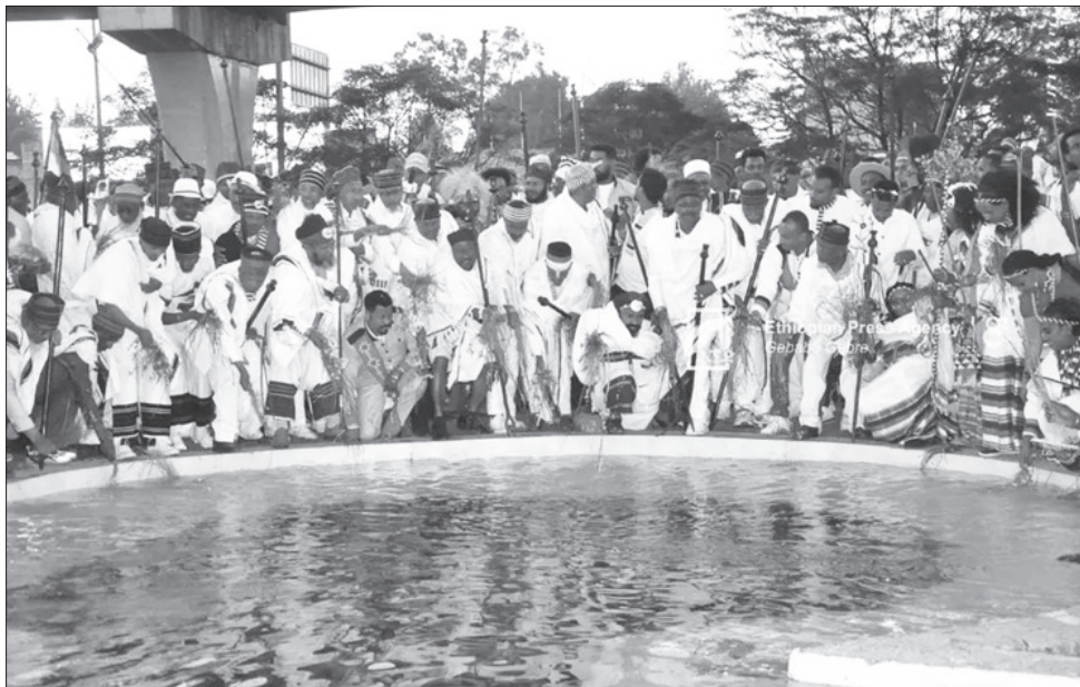
ወደሆነችው አዲስ አበባ በመምጣት ማክበራቸውን አስታውሰዋል።

የመስቀል ደመራ በዓልን ኢትዮጵያውያን ከአራቱም ማዕዘን የረሳቸውን የባህል አልባሳትና ጌጣጌጥ ለብሰው እንዲሁም የተለያዩ የዓለም ሀገራት ቱሪስቶች የተለያዩ ብሔር ብሔረሰቦች መኖሪያ እና የአንድነት ተምሳሌት