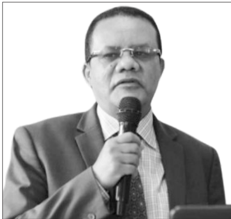
አምባሳደር ደገፊ ቡላ