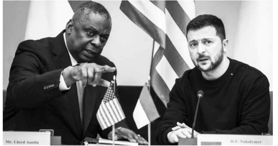
የአሜሪካ የመከላከያ ሚኒስትርና የዩክሬን ፕሬዚዳንት

ጥቃት ከፈጸመች በኋላ ወደ ፊት ለመጓዝ ጥረት እያደረገች ሲሆን፤ ሩሲያ በበኩሏ በጦርነቱ የዩክሬን ዋና