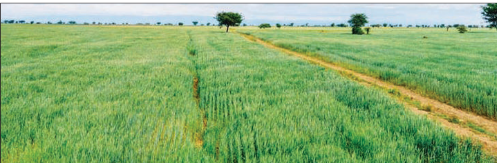
የስንዳ ልማት አንዱ የምግብ ሉዓላዊነትን የማረጋገጥ ስኬታማ ሥራ ማሳያ