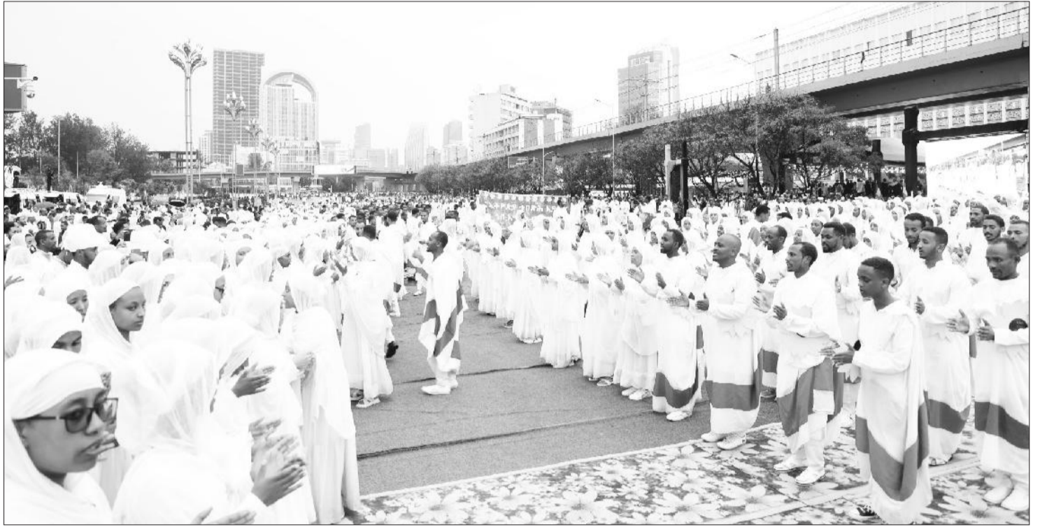
የመስቀል ደመራ በዓል አካባቢ ከሀገሪቱ የቱሪስት መስሪቶች አንዱ ነው