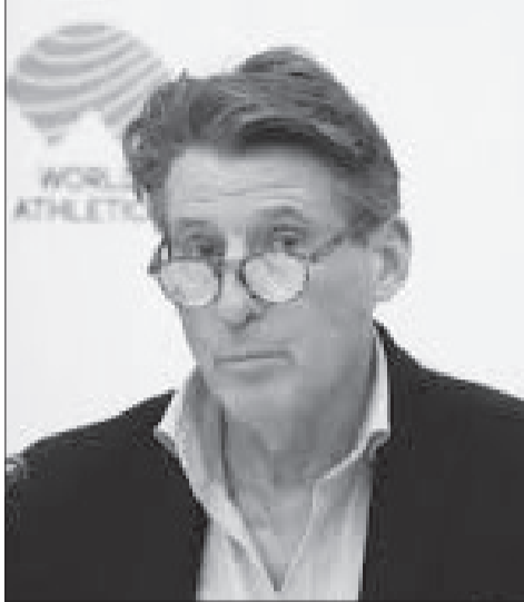
የዓለም አትሌቲክስ ፕሬዚዳንት ሰባስቲያን ኮ፤

በምርጫው አሸናፊ ይሆናሉ በሚል የተገመቱት ሁለቱ አጠቃላይ ኮሚቴዎቻቸው የምርጫው ዘመቻ ፋክቲካ ባለፈ ሁለቱም አሊምፒክን በተወዳዳሪነት የሚያወቁትና የመድረኩን ታላቅነት ያጣጣሙ የቀድሞ አትሌቶች መሆናቸው የመሰላቸዋል። ትኩረት ሳቢያና ነጭ የቆዳ ቀለም ያላት