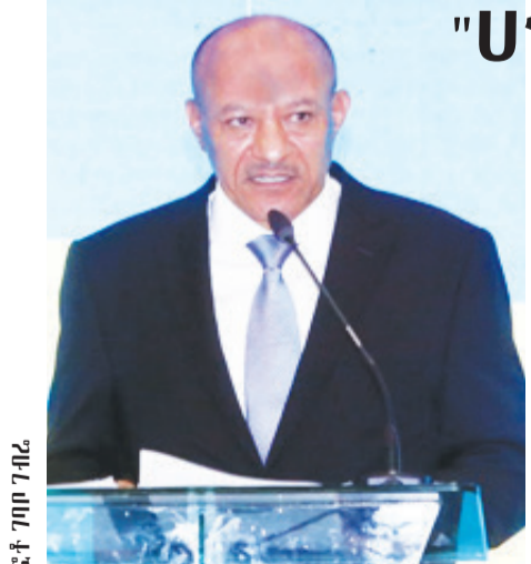
ፎቶ ገበየ ገበየ

መስፋፋትና ለአፍሪካ ምርቶች የገበያ መዳረሻዎችን ማመቻቸት ላይ ትኩረቱን እንደሚያደርግም ይነገራል። የትብብር ትስስሩ የበይ ተመልካች የሌለበት ስለመሆኑም በተለያዩ ጊዜያት አስተያየታቸውን የሚሰጡ የጋራ ተጠቃሚነት ... ወደ ገጽ 4 ዞሯል