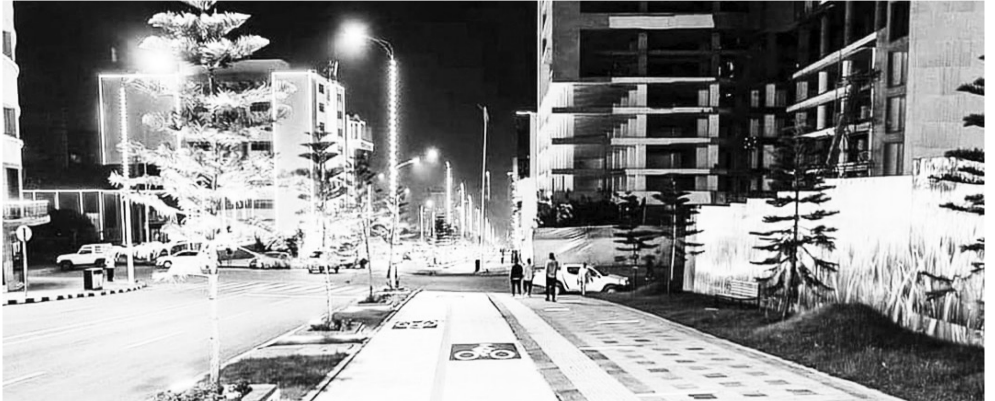
የኮሪዶር ልማት ክፍል ገጽታ