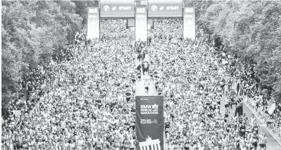
በዘንድጮ የበርሊን ማራቶን 50 ሺህ ተሳታፊዎች ይጠበቃሉ።

የኢትዮጵያ እና ኬንያ አትሌቶች በወንዶች እኩል ከ1999 አንስቶ በሴቶች ደግሞ ከ2009 አንስቶ አንድም የሌላ ሀገር አትሌት ሳይቀላቅሉ እርስ በእርስ በመተካካት የበላይነቱን ይዘዋል። በዚህ ውድድር የሚካፈሉት አትሌቶች አብዛኛዎቹ ወጣት ቢሆኑም እንደተለመደው አዲስ ነገር ያሳያሉ ተብለው ይጠበቃሉ። ኢትዮጵያዊያኑ አትሌቶች ታደሰ ታከለ እና ትዕግስት ከተማ ደግሞ