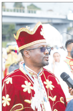
ሲቀልሳናት መምህር የጳጳሳዊት ጋይሰሥላሴ