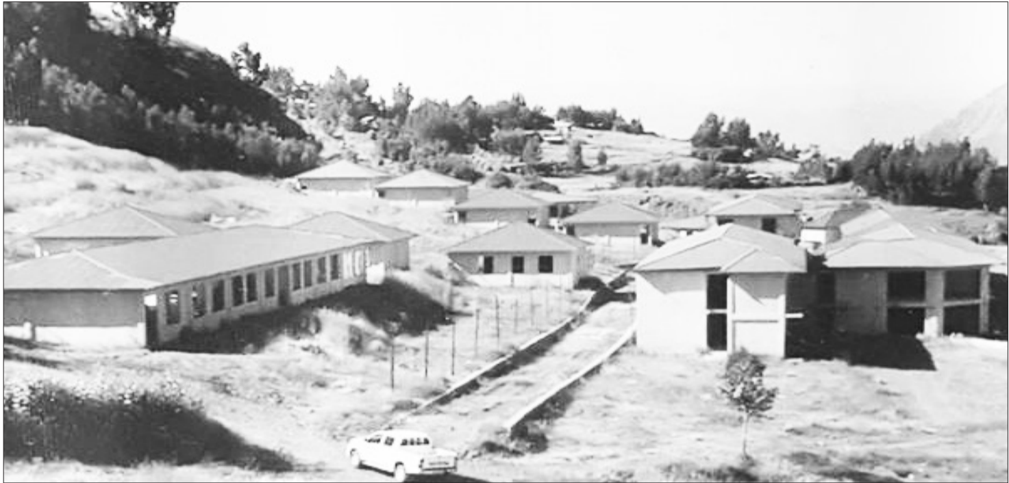
የደሴ ስዳሪ ትምህርት ቤት።