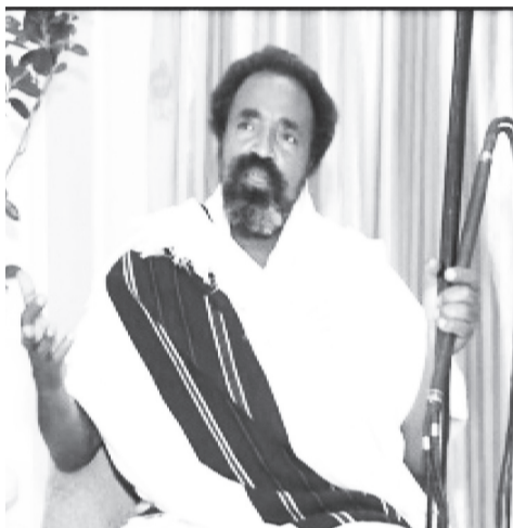
አባ ገዳ ጎበና ሆላ

በኢትዮጵያ ውስጥ ከ83 በላይ ብሔር ብሔረሰቦች በሃይማኖት፣ በዘርና በቋንቋ ሳይለያዩ በራሳቸው መገለጫዎች በአንድነት ይኖራሉ ያሉት አባ ገዳ ጎበና፣ እነኚህ ብዙሃ ማንነቶች በራሳቸው የባህል አልባሳት አገጠው አንዱ በሌላው ብሔር በዓል በመገኘትና በማክበር አብሮነታቸውን ለማጠናከር ያግዛል ብለዋል።