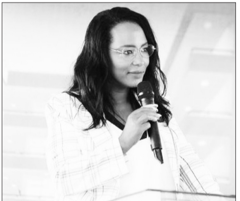
ከንቲባ አዳነች አበቤ

ከተማ የተገነቡ፣ የመጻፍጃና የማብሰያ ቦታ እንዲሁም ሰፊ ክፍሎች ያላቸው ሆነው የተለወጡ መሆናቸውንም ጠቁመዋል።