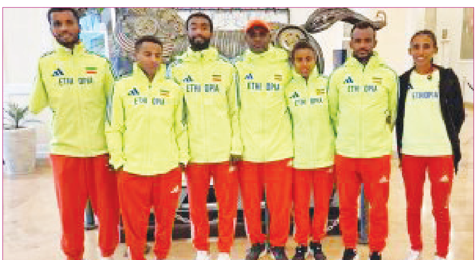
የኢትዮጵያ ፓራሊምፕክ ቡድን ከዓለም 27ኛ ከአፍሪካ ደግሞ 2ኛ ደረጃን በመያዝ አጠናቋል።

የርቀቱ የወርቅ ሜዳሊያ አሸናፊ የነበረው ብራዚላዊ ጃክሁዊስ ሄልትሲን የአሸናፊነት ግምት ከተሰጣቸው አትሌቶች አንዱ የነበረ ሲሆን፣ ፓሪስ ላይም በድንቅ ብቃት የወርቅ ሜዳሊያ አሸናፊ ሆኗል። 3:55:52 ውድድሩን ያጠናቀቀበት ሰዓት ሲሆን የርቀቱ አዲስ የዓለም ክብረት ሆኖም ተመዝግቧል።