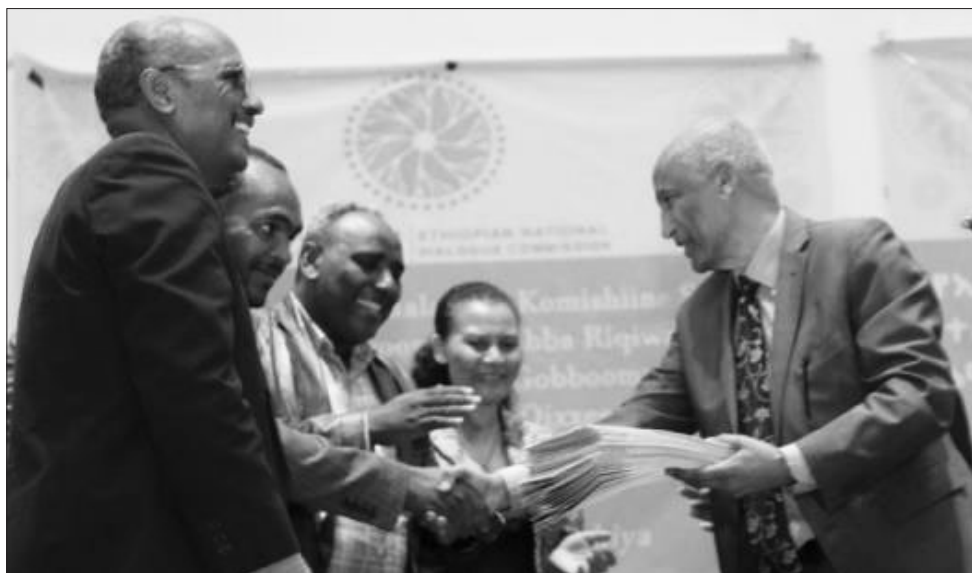
ኮሚሽኑ በሲዳማ ክልል የተሰበሰቡ አጀንዳዎችን ተረክቧል

ትልልቅ ተቋማት ሀብታሚዎችን በተደራጀ መልኩ ለኮሚሽኑ እያቀረቡ መሆኑን የተናገሩት ዋና ኮሚሽነር፤ ማንኛውም የውይይት አጀንዳ ያለው ወገን ያለውን አጀንዳ ለኮሚሽኑ ማቅረብ እንደሚችል