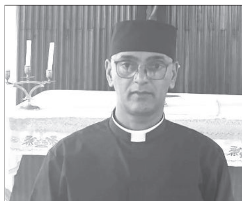
በኢትዮጵያ ካቶሊካዊት ቤተ ክርስቲያን የሚገኙት የሚገቡ ሰጥሞዎች ስብሰባ ላይ ለሰጠው ትዕዛዝ ላይ ለሚገኙት የሚገቡ ሰጥሞዎች፡፡