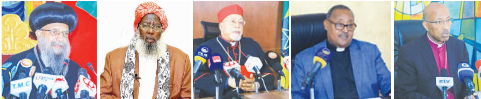
ስቡኅ ማቲያስ ቀዳማዊ ፓትሪያርክ ሸህ ሐጃ ሲብራኪም ተፋ ብጹኅ ካርዲናል ስቡኅ ብርሃነአዲስ ፓስተር ጳድቀ ስብዶ ጌብ ዶ/ር ዮናስ ደገዙ