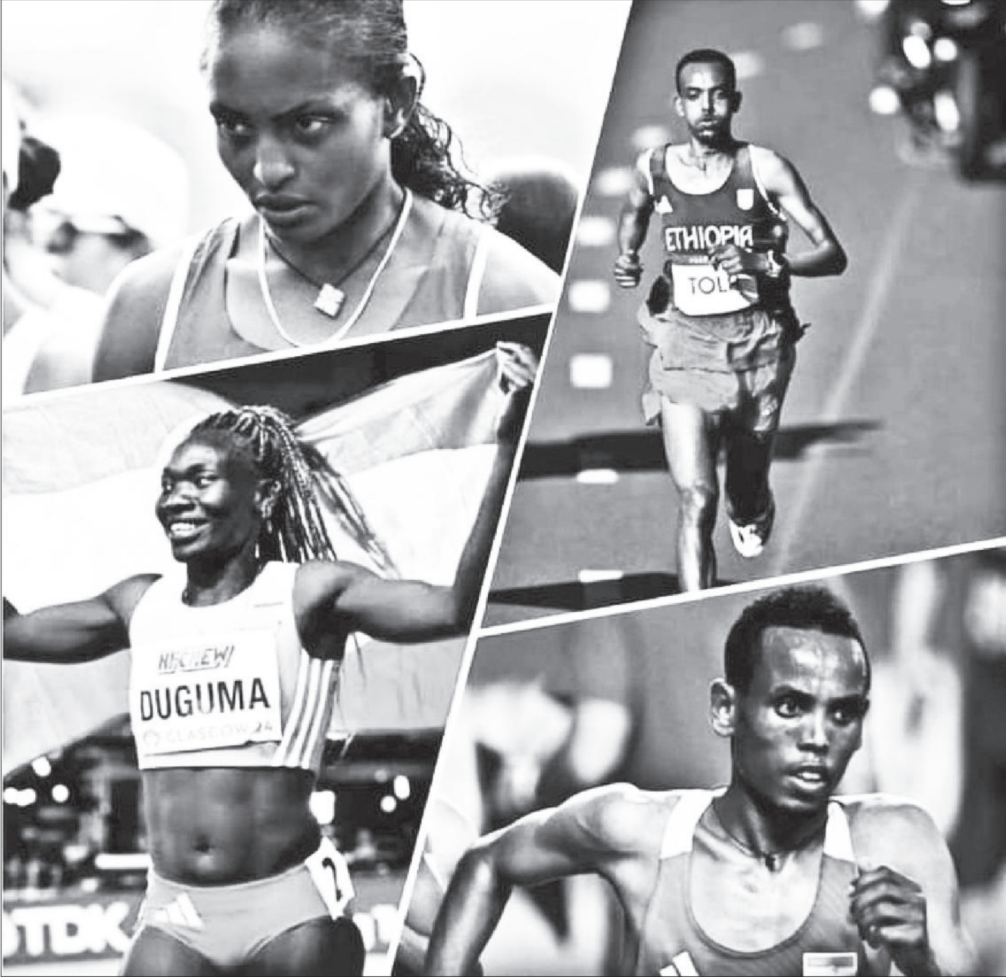
ታምራት ቶሳ ከ24 ዓመት በኋላ በኦሊምፒክ ማራቶን ፓሪስ ላይ ሲያሸንፍ፣ ትዕግስት አሰፋ፣ በሪዬ ስሪጋዊና ፊጊ ዱጉማ የብር ሜዳሊያ ያጠለቀ ኢትዮጵያውያን ሆነዋል።

ዓመቱ ኢትዮጵያ ዝናን ባተረፈችበት የአትሌቲክስ ስፖርት ዓለም አቀፍ ውድድሮች ላይ የተወከለችበትም ነበር። በየዓለም የጎዳና ላይ አትሌቲክስ ቻምፒዮና የጀመረው 2016፤ የዓለም የቤት ውስጥ ቻምፒዮና፣ የአፍሪካ ቻምፒዮና፣ የአፍሪካ ጨዋታዎች፣ የዓለም ሃገር አቋራጭ ቻምፒዮና፣ ኦሊምፒክን እንዲሁም የዓለም ከ20 ዓመት በታች ቻምፒዮና የተከናወኑበት ነበር።