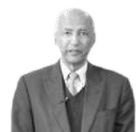
መስፍን አርጋይ (ፕ/ር)

በመሆኑም፣ 2017 በብዙ መንገድ ሰላማችን፣ ዘላቂ ልማታችን፣ የአካባቢ ጥበቃችንን እና ሠብዓዊነታችንን አጥብቀን የምንይዝበት፣ ተረጋጅነትንም በእጅጉ የምንጸድቅበት እና ከምግብ ዋስትና ወደ ምግብ ሉዓላዊነት ለምናደርገው ጉዞ የመስፈንጠሪያ አቅም የሚሆኑ ተግባራትን የምንፈጽምበት ሊሆን ይገባል።