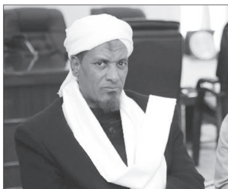
የኢትዮጵያ ጽርቶዎች ጉዳይ ላይ ለሚገኙት የሚገቡ ሰጥሞዎች ስብሰባ ላይ ለሰጠው ትዕዛዝ ላይ ለሚገኙት የሚገቡ ሰጥሞዎች፡፡