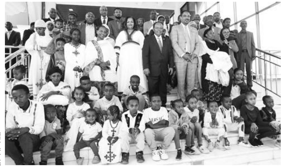
ግንባታ ማስጀመሪያ ሥራ አከናውኗል።

እንደ ሚኒስቴሩ ገለጹ፤ ተቋም የአቅም ደካሞችን ቤት የማደስና ማዕድ የማጋራት ተግባራትን አከናውኗል። በተጨማሪም በአርባ ምንጭና ወላይታ ሶዶ ከተሞች ድጋፍ ለሚሹ ከ400 በላይ ተማሪዎች የትምህርት ቁሳቁስ ድጋፍና ለአራት አቅም ደካማ ቤተሰቦች ደረጃውን የጠበቀ የቤት