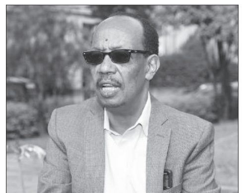
በኢትዮጵያ ሕይወት ብርሃን ቤተ ክርስቲያን የሚገኙት የሚገቡ ሰጥሞዎች ስብሰባ ላይ ለሰጠው ትዕዛዝ ላይ ለሚገኙት የሚገቡ ሰጥሞዎች፡፡