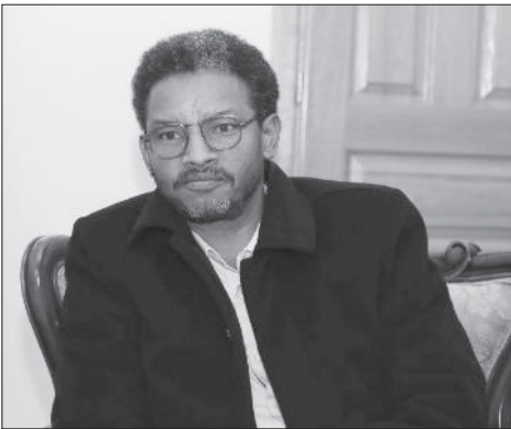
በኢትዮጵያ ጽርቶዎች ተዋህዶ በተከሰቱት የአዲስ አበባ ሀገራዊ ስብሰባ ላይ ለሰጠው ትዕዛዝ ላይ ለሚገኙት የሚገቡ ሰጥሞዎች፡፡