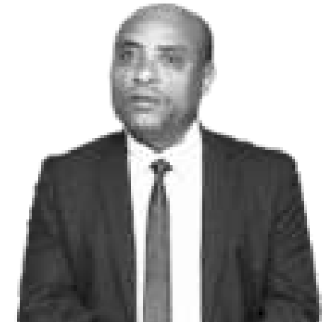
ከይረዲን ተዘራ (ዶ/ር)