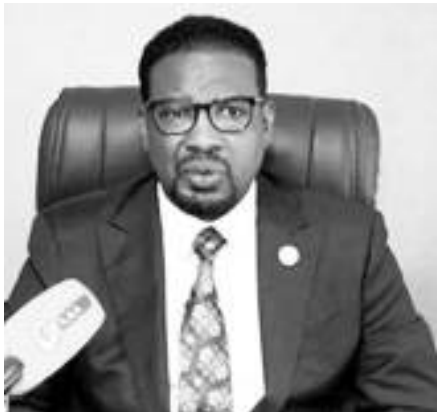
ሲቀ ትጉሃን ቀሲስ ታጋይ ታደሰ