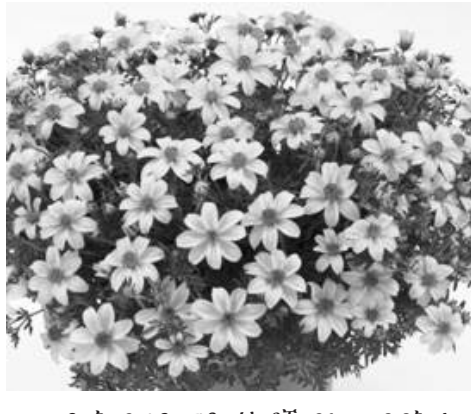
ጉዞ ወደፊት የሚያረምዱ ስኬቶች የተመዘገቡበት ነው ብለዋል።

የተጠናቀቀው 2016 በጀት ዓመት የተለያዩ ጫናዎችን በመቋቋም በሀገራችን ኢትዮጵያ የተጀመረውን የብልጽግና