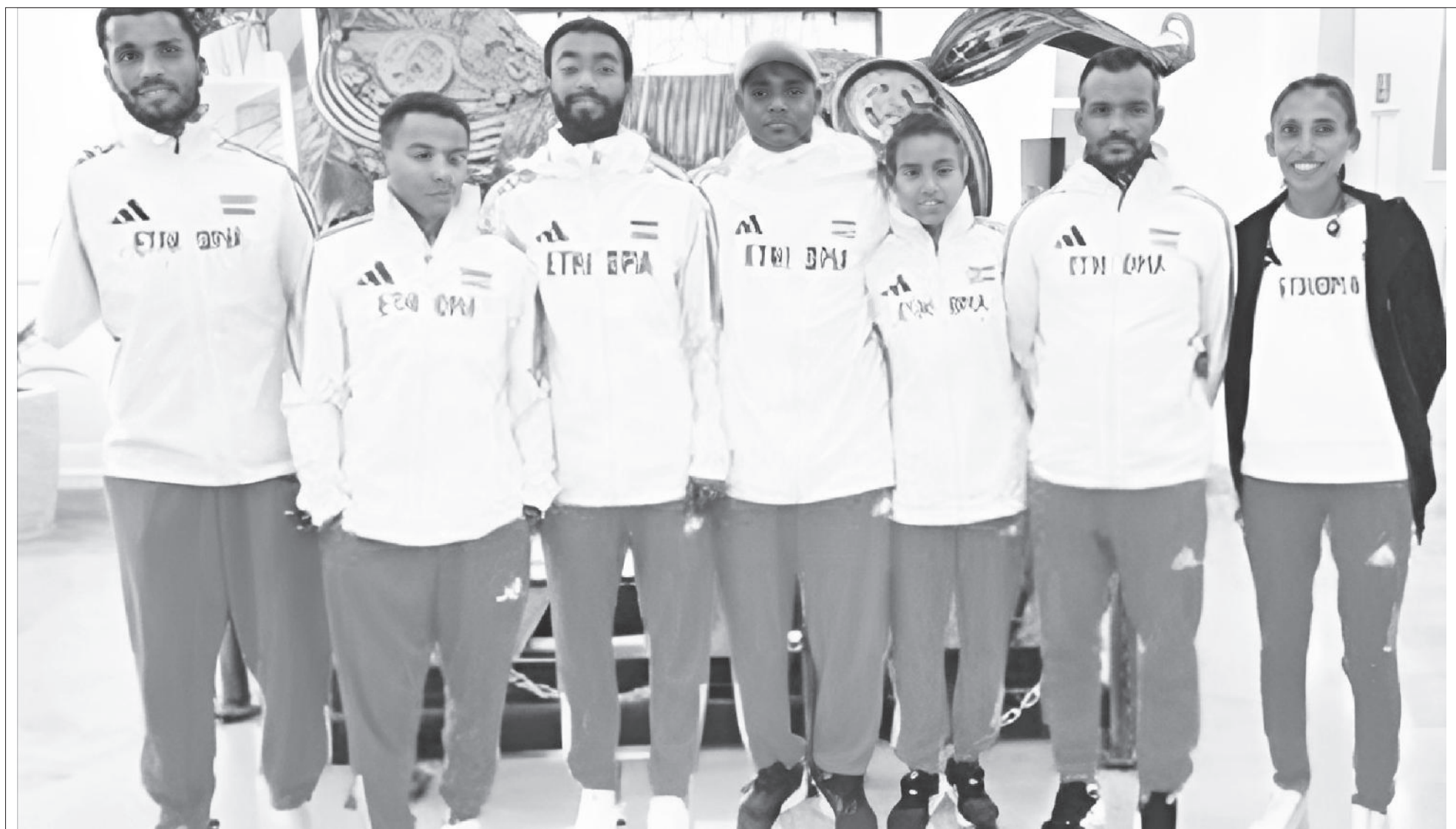
በፓሪስ ፓራሲምፒክ የተሳተፈው የኢትዮጵያ ቡድን 2 ወርቅና 1 ብር በማስመዘገብ አዲስ ታሪክ ሰርቷል።