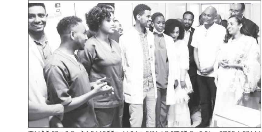
ሚኒስትሯ በዓውደ ዓመት ከቤተሰቦቻቸው ተሰይደው በሥራ ላይ የሚገኙ የጤና ባለሙያዎችን ሲያበረታቱ

የጤና ሚኒስቴር አመራር እና ሰራተኞች ይህን የህብር ዕለት "ጤናማ ትውልድ ለአብሮነትና ለሀገር ግንባታ" በሚል አብሮነትን በሚያጠናክር መሪ ሀሳብ ነው ያከናወኑት። በአካባቢ ሥነ- ሥርዓቱ ላይ የጤና ሚኒስትሯ ዶ/ር መቅደስ