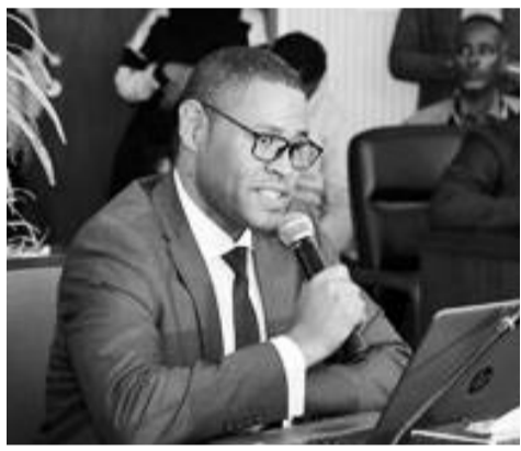
አቶ የትምህርት አስተዳደር

በመንገድ ጥግግት በኩል በአንድ ሺህ ኪ.ሜ ሜትር ስኳር ወሰን የዓለም አማካይ የመንገድ ጥግግት 944