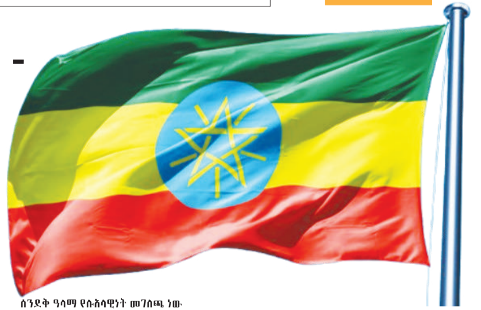
ሰንደቅ ዓላማ የሉዓላዊነት መገለጫ ነው