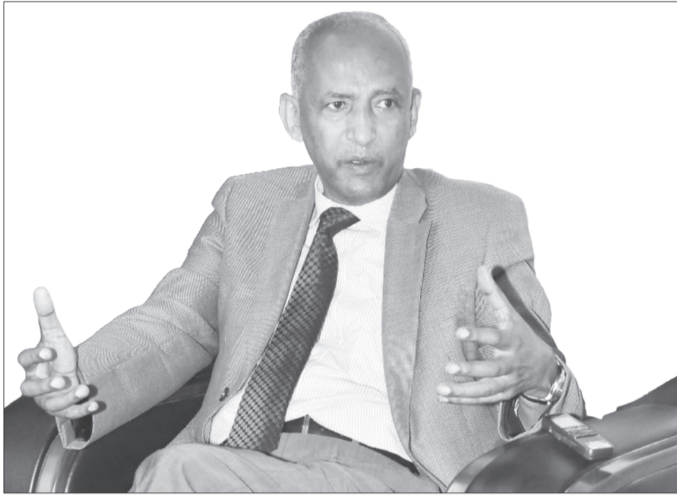
ፕሮግራም መሰሪያ አርዳዎ

የተሰበሰቡ አጀንዳዎች ከክልልና ከፌዴራል ባለድርሻ አካላት ጋር በመሆን በ2017 ዓ.ም አጋማሽ ላይ ዋናው ሀገራዊ የምክክር ጉባኤ ይካሄዳል በማለት፤ በዚህ ሂደት ውስጥ በቅርቡ ለሀገራዊ ምክክር ጉባኤው ተሳታፊዎችን በመለየት በሲኒካንጉል ጉሙዝ፣ በሲዳማ፣ በማዕከላዊ ኢትዮጵያ፣ በሀገራዊ ሌሎች ክልሎችና ከተማ መስተዳድሮች የአጀንዳ አሰባሰብ ሥራ መከናወኑን ጠቅሰዋል። ከሚቀጥሉት ቀናት ጀምሮ በአፋርና