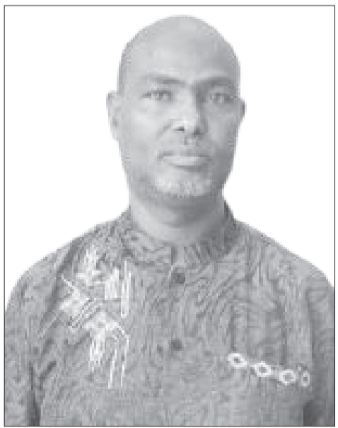
አት አህመድኑር አብዲ

በክልሉ የታቀደውን 31 ሚሊዮን ኩንታል ምርት በማግኘት ምርትና ምርታማነትን ለማሳደግ ሰብሎችን