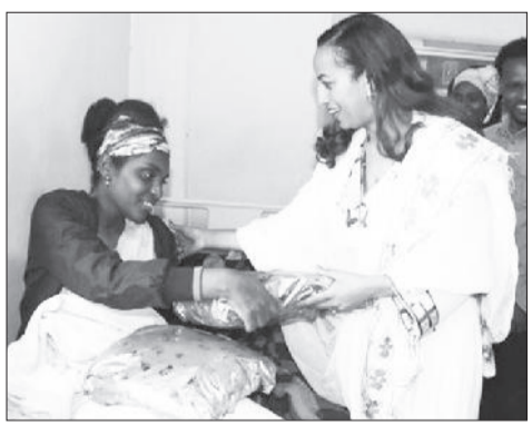
ዓውደ ዓመትን ምክንያት በማድረግ በጤና ሚኒስትሯ ስጦታ ከተደረገባቸው ወልደሙ በሆስፒታል ከተኛ እናቶች ስንዳ

የጤና ሚኒስቴር ይህን የ2017 ዓ.ም አዲስ ዓመት ዋዜማ በተለየ ሁኔታ ነው አክብረውት የዋሉት። ..የገን ቀን.. የተሰኘ ስያሜ ያለው እንደመሆኑ ሁሉ ለገን ተስፋ የሚሆኑ ሕፃናትን