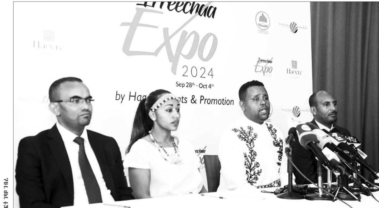
ፍት 7ግዞ ገብረ

ለተገኛዎች ማካካሻ እንደሁኔታው ተጠቃሚ የሚሆኑበት ሥርዓት ፖሊሲው ማመልከቱንና ሕገ መንግሥቱ ከጸደቀበት ከ1987 ዓ.ም አንስቶ የተፈጸሙትን እንዲያካትት ውሳኔ ላይ መደረሱንም ነው የገለጹት።