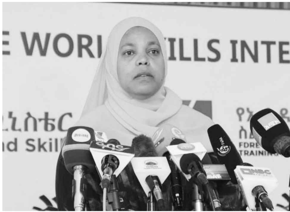
ወይዘሮ ሙፈሪሃት ካሚል

እንደ ሚኒስትሯ ገለጻ፤ አባልነቱ ከተቀረው ዓለም የሚፈጠሩ ተጨማሪ እድሎችን ለማግኘት የሚያስችል እና አዲስ አውድ የሚፈጥር ነው። ከመላው ዓለም የሚመጡ የተለያዩ የህብረተሰብ ክፍሎች በየሁለት ዓመቱ በአንድ ላይ ተገናኝተው የሚያካሂዱት መድረክ በመሆኑ