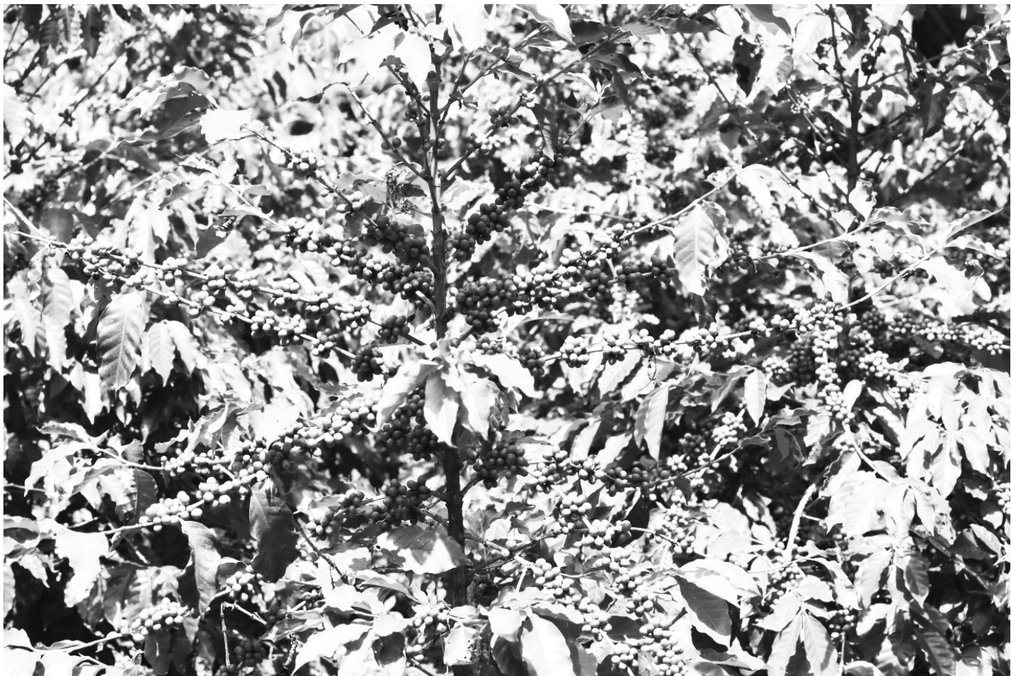
የበበቃ ቡና እርሻ ልማት በክሬል፣

በልማት በኩል የመንገድ ሥራ ይገኝበታል። የእርሻ ልማቱ በሰባት አቅጣጫ ይዋሰናል። አዋሳኝ በሆኑ ሰባት ቀበሌዎች መንደር ከመንደር፣ እንዲሁም ቀበሌን ከቀበሌ የሚያገናኙ የመንገድ መሠረተ ልማት ለመሥራት ጥረት ተደርጓል። ትምህርት ቤትን ጨምሮ የተለያዩ ግንባታዎች ሲከናወኑም ጥያቄዎች ስለሚቀርቡ በተቻለ መጠን ትብብር ይደረጋል።