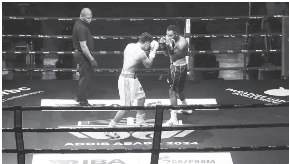
በአዲስ አበባ ስመጀመሪያ ጊዜ በተካሄደው ዓለም አቀፍ የቦክስ ፍልጫ ሁለት ኢትዮጵያውያን ቦክሰኞች ጥሩ ተጫካሪ ነበሩ።

የኢትዮጵያ ቦክስ ኮንፌዴሬሽን ፕሬዚዳንት እና የአፍሪካ ቦክስ ኮንፌዴሬሽን ፕሬዚዳንት እያሱ ወሰን በበኩላቸው፣ ጽሕፈት ቤቱ አዲስ አበባ ላይ እንዲከፈት መንግሥትን ጨምሮ እገዛ ላደረጉ አካላት ምስጋና አቅርበዋል። በአለቱ ምሽት ላይ በዓድዋ መዘደም የተካሄደውን የአፍሪካ ኢንተርናሽናል ቦክስንግ አሰሪዎችን (IBA) ውድድርን ጨምሮ ሌሎች ዓለም አቀፍ ውድድሮችን በማዘጋጀት ለስፖርቱ እድገትና ተወዳጅነት እንደሚሠሩ ገልጸዋል።