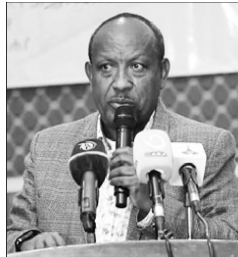
ሐት ጅማል ስልደ

ኢትዮጵያ እ.ኤ.አ በ2021 እና በ2022 ዓመታት ብቻ ከአምስት ነጥብ ስምንት ሚሊዮን በላይ