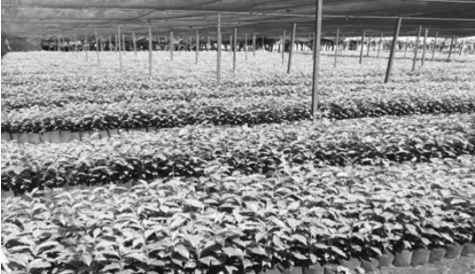
የመተካት ሥራዎች እንደሚሠሩ ተናግረዋል።

በክልሉ የቅድመ ዝግጅት ሥራዎች ካለፈው ዓመት ጀምሮ ሲከናወኑ መቆየታቸውን አስታውሰው፤ በዚህ ዓመትም ለየት ባለ ሁኔታ ከዚህ ቀደም የተተከሉ ችግኞችን የመንከባከብና