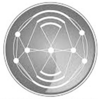
በኢ.ፌ.ዲ.ሪ የመንግሥት ኮሙኒኬሽን አገልግሎት FDRE Government Communication Service

የኢትዮጵያ ምርጫ ቦርድ ከሰሞኑ በተሻሻለው የምርጫ አዋጅ ቁጥር 1332/2016 አንቀጽ 2 (1) መሠረት ለሕወሓት የምዝገባ ምስክር ወረቀት መስጠቱን ገልጧል። መንግሥት ሕገ መንግሥታዊ ተቋማት በሕግና በተቋማዊ ነፃነት የሚወስኑትን ውሳኔ ይቀበላል። ያደንቃል። የለውጡ አንዱ ፍሬ ነው።