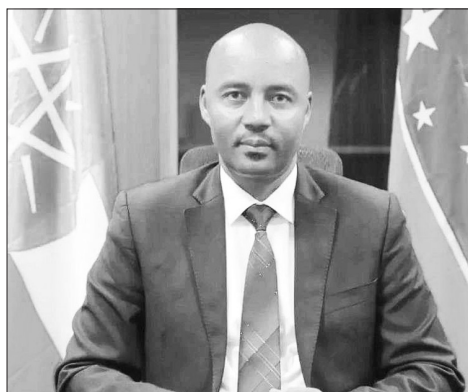
ሕገ በየነ በራሳ