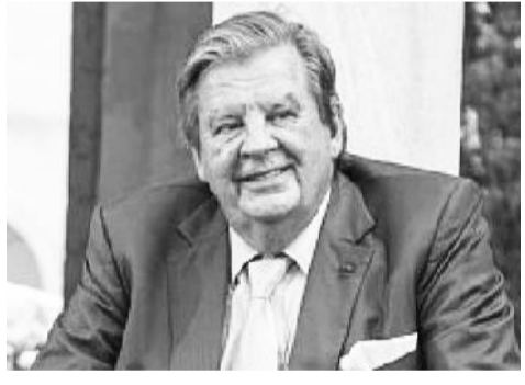
ዳንጎቴ ሪፖርተር በፎርብስ መጽሔት ለተከታታይ 13ኛ ጊዜ የአፍሪካ ቁጥር ሕንድ ሀብታም ተብለው ነበር።

147 ደረጃ እና ከዳንጎቴ ደግሞ 12 ደረጃዎችን ከፍ እንዲል አድርጎታል። ብሉምበርግ እንደዘገበው ከሆነ፣ የናይጄሪያው ሀብት በ1 ነጥብ 7 ቢሊዮን ዶላር ቀንሶ አጠቃላይ ሀብቱ 13 ነጥብ 4 ቢሊዮን ዶላር ሆኗል። የዳንጎቴ ሀብት መጠን መቀነስ አብዛኞቹ ኩባንያዎቹ ያሉባትን የናይጄሪያን የኢኮኖሚ ፈተና የሚያሳይ ነው። ዳንጎቴ ግሩፕ የተባለው የግድ ድርጅታቸው በነዳጅ ማጣሪያ ኩባንያው በፈጠረው የምርት መዘግየት እና በአቅርቦት መዘግየት ምክንያት በርካታ ችግሮች አጋጥሞታል። ሀገሪቱ ኢኮኖሚያዊ ችግር ውስጥ ብትሆንም፣ ዳንጎቴ ባለፈው ጥር ወር