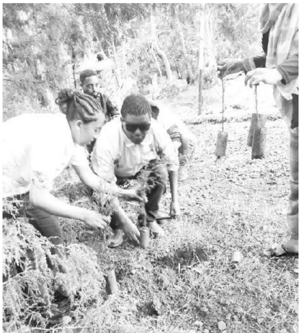
ሕዲስ ጉዳተኞች በሕረንጌ ዐሻራ ገብ ተሳትፎ ስድርገዋል።

ታያቸው አነሳሽነትና በሌሎች የረድዔት ድርጅቶች የተገነቡ የአይነ ስውራን አዳሪ ትምህርት ቤቶችም የአካል ጉዳተኞችን የትምህርት ተደራሽነትና ጥራት ያረጋገጡና ለነገሩ ኢትዮጵያ ከሌላው ዜጋ እኩል በሁለንተናዊ መልኩ አስተዋፅኦ የሚያበረክቱ ናቸው። እንዲያም ሆኖ ግን በኢትዮጵያ ካለው የአካል ጉዳተኞች ቁጥር አንጻር ይህ ጅምር እንጂ ፍጻሜ አይደለም። አካል ጉዳተኞችን በሁለንተናዊ መልኩ ተጠቃሚ ለማድረግ አሁንም በርካታ ስራዎችን በመንግሥትና በሁሉም ጉዳዩ በሚመለከታቸው አካላት መስራት ይጠይቃል።