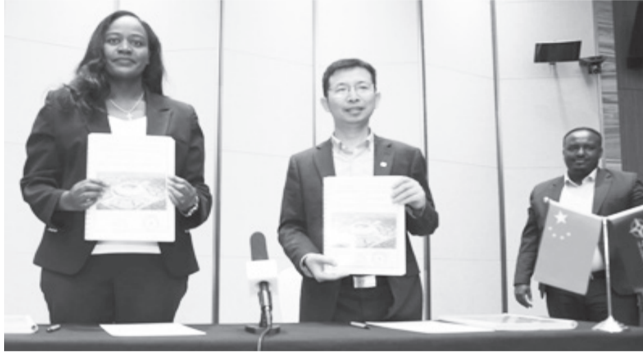
የግንባታ ስምምነቱ በአፌሪካ ባህልና ስፖርት ሚኒስቴር እንዲሁም በቻይና ኮንስትራክሽን ኮሚቴ (CCCC) መካከል ተፈጽሟል።

ምዕራፍ አንድ ስራው ሙሉ ለሙሉ የተጠናቀቀው የግንባታው ቀሪዎቹን ስራዎች በዚህ አንድ ዓመት ውስጥ በማጠናቀቅ ወደ ሎት ሁለት የሚሸጋገር ይሆናል። በስምምነቱ መሰረትም በስታዲየሙ ውስጥ እንዲሁም ውጪ የሚቀሩ ግንባታዎች ይከናወናሉ። ይኸውም ዓለም አቀፍ ደረጃቸውን የጠበቁ የእግር ኳስ ሜዳ፣ ማሟሟቂያ፣ የመሮጫ መም፣ የ60ሺ ወንበር ገጠማና ሌሎችንም የሚያጠቃልል ይሆናል። የቴክኖሎጂ ስራዎች እንዲሁም በስታዲየሙ ውስጥ ያሉ ዘርፈ-በዙ ክፍሎች የማጠቃለያ፣ የኤሌክትሪክና ፍሳሽ ማስተላለፊያ መስመሮች ዝርጋታ