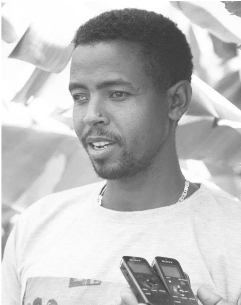
ወጣት አዳኝ ሹሜ

ከተተከለ አንድ ዓመት የሆነው ሙዝም ቢሆን ማፍራት መጀመሩን ከስራ የሚያበልቀውን ውላጅ ችግኝ (ሰከር) ለሌሎች የአካባቢው አርሶ አደሮች እየሸጠ ተጠቃሚ መሆን መቻሉን ወጣት እንዳለ ያስረዳል። «ከአንድ ሙዝ ሰከር ብቻ 60 ብር አገኛለሁ፤ ሙዙ ሙሉ ለሙሉ ሲበስል ደግሞ እያንዳንዱ ግንድ 40 ኪሎ የሚይዝ በመሆኑ የማገኘው ገቢ በከፍተኛ መጠን እንደሚጨምር አልጠራጠርም» ሲል በቀርጠኝነት ይናገራል። ሙዙ ደርሶ ለገበያ ሲያቀርብም አንዱን ኪሎ