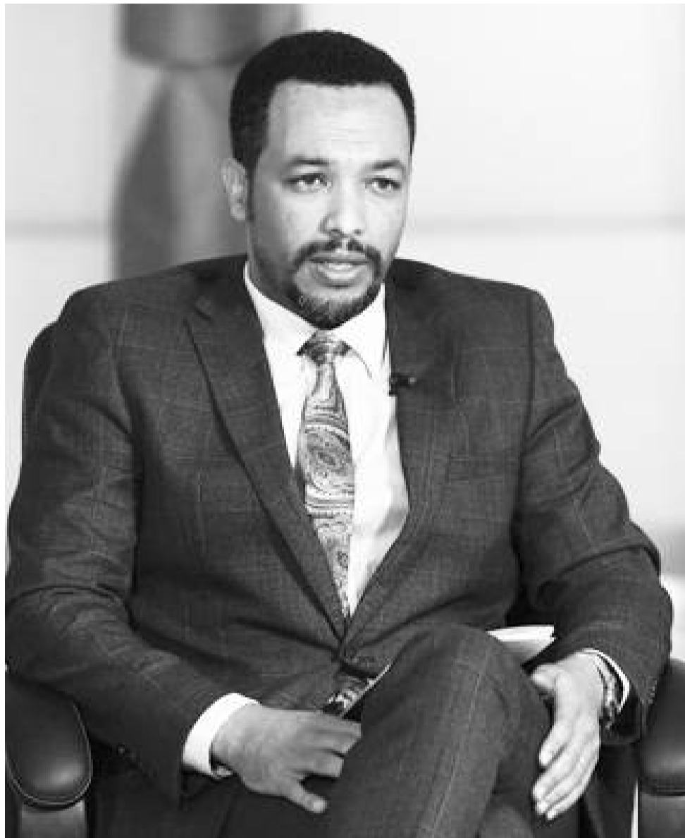
የጤና ሚኒስቴር ሚኒስትር ዴኤታ ዶክተር ደረጃ ዱጉማ።

ህፃናቱ ክትባት ሳያገኙ ወይም ክትባቱን ጀምረው ለማቋቋማቸው በርካታ ምክንያቶች ይጠቀሳሉ። በዋናነት ግን በሀገሪቱ የነበሩ የተለያዩ ግጭቶችና የድርቅ አደጋዎች ህፃናቱ ክትባት እንዳያገኙና የጀመሩትን ክትባት እንዳያጠናቁ ምክንያት ሆነዋል። በእያንዳንዱ ክልል በሚገኙ ወረዳዎች ምን ያህል ህፃናት ክትባት እንዳላገኙና አግኝተው ያቋጡት ምን ያህል እንደሆኑ ጥናት ተሰርቷል። እነዚህን ህፃናት በክትባት ተጠቃሚ ለማድረግ የማካካሻ ክትባት መርሃ ግብር/big catch policy/ ከሶስት ወራት በፊት ተዘጋጅቷል። እስካሁን ድረስ በመደበኛው ክትባት ክትባት ጀምረው ያቋረጡና ያልጀመሩ ህፃናትን ተጠቃሚ ለማድረግ ጥረት ተደርጓል። በዚህም በመቶ ሺ የሚቆጠሩ ህፃናት ሙሉ በሙሉ ክትባት እንዲያገኙ ተደርጓል። በዚህ ብቻ ግን የሚያበቃ መሆኑን በማየት ለአስር ቀን የሚቆይ የክትባት ዘመቻ በሀገር አቀፍ ደረጃ ለማድረግ ተወስኗል። የክትባት ዘመቻውም ካለፈው ማክሰኞ ጀምሮ በይፋ ተጀምሯል።