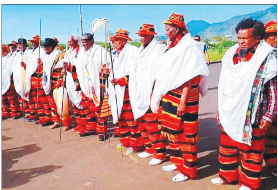
የጋሞ የሀገር ሽማግሌዎች ለሀገራዊ ምክክር መሳካት እንደሚሠሩ ስላውቀዋል

የአዲስ አበባው መድረክ በያገባኛልና የሃላፊነት መንፈስ መካሄዱ በቀጣይ ለሚከናወኑ ሥራዎች መሠረት