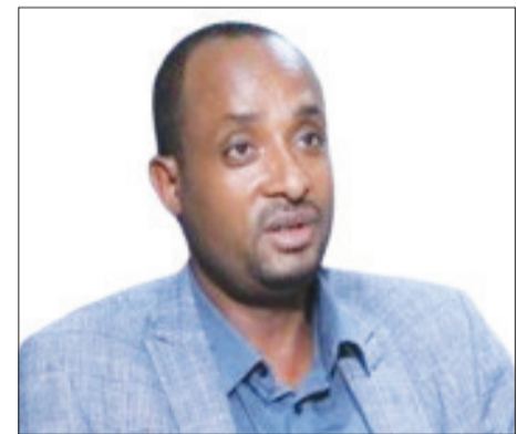
ሕገ ተክሲ ጃንባ፣