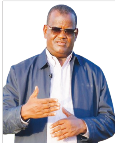
ሕገ ስልጣን ሱሪር