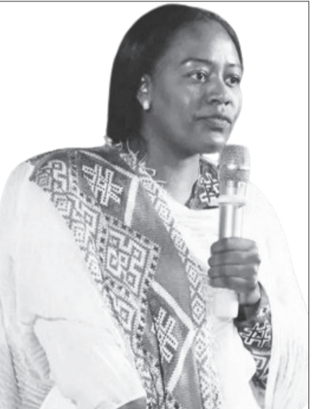
ወይዘሮ ሸዌት ሻንካ

አዲስ አበባ፡- የጥበብ ኢንዱስትሪ ዘርፉ በሀገረ መንግሥት ግንባታ ትልቅ አቅም ያለው በመሆኑ ይህንን አቅም በአግባቡ ልንጠቀምበት እንደሚገባ የባህልና ስፖርት ሚኒስትር ወይዘሮ ሸዌት ሻንካ ገለጹ። የባህልና ስፖርት ሚኒስቴር የ2017 በጀት ዓመት የሥራ እቅድ ትውውቅ እና ጠቅላላ የሠራተኛ መድረክ በትናንትናው እለት ተካሂዷል። በመርሀግብሩ ላይ የተገኙት የባህልና ስፖርት ሚኒስትሩ ወይዘሮ ሸዌት ሻንካ እንደገለጹት፤ ዘርፉ በተለይም በሀገረ መንግሥት ግንባታ ላይ ትልቅ አቅም ያለው ነው። ኪነጥበብ፣ ሥነጥበባትን እና ስፖርትን በጋራ በማስኬድ የሚሠራ ሲሆን በቀጣይ የተሻለ ውጤት ለማስመዘገብ በጋራ መሥራት ይገባል ብለዋል። ለዚህም ያሉንን የተለያዩ እሴቶችን በማስተሳሰር መሥራት ትልቅ አስተዋፅኦ ያለው በመሆኑ በባህል፣ በጥበባትና በስፖርት ዘርፍ ማልማትና ዘላቂ የማኅበራዊና ምጣኔ-ሀብታዊ ጥቅምን ማረጋገጥ ይገባል ብለዋል። የባህልና ስፖርት ሚኒስቴር የስትራቴጂ ጉዳዮች ሥራ አስፈጻሚ አቶ እንደራሰ አብዱ የ2017 በጀት ዓመት እቅድ ባቀረቡበት ወቅት እንደገለጹት፤ በጥበብ ፈጠራ ኢንዱስትሪ ዘርፍ ያለንን አቅም በማሳደግ ምጣኔ ሀብታዊ እና ማህበራዊ ፋይዳን ማግለጫ ይገባል። ለዚህም ሚኒስቴሩ በጥበብ ፈጠራ ኢንዱስትሪን የማግለጫና ተጠቃሚነትን እንዲሁም በጥበባት ዘርፍ ባለሙያዎችና ሕዝባዊ አደረጃጀቶች አቅምን ለማሳደግ ይሠራል ብለዋል። በ2017 በጀት ዓመትም ሀገር ውስጥ የሚሠሩ የኪነ ጥበብ እና የሥነ ጥበብ ምርቶችና አገልግሎቶችን የማስተዋወቅና ግብይት የመፍጠር እንዲሁም በሀገሪቱ የሚገኙ ልዩ ልዩ ባህላዊ እሴቶችን የሚጨምሩ የኪነጥበብ ሥራዎች ለማስፋፋት እንደሚሠሩ ጠቅሰዋል። እንዲሁም የዕድል ጥበብ ምርታማነትን ለማሳደግ የሚያስችል የሕግ ማእቀፍ ከማዘጋጀት ጀምሮ