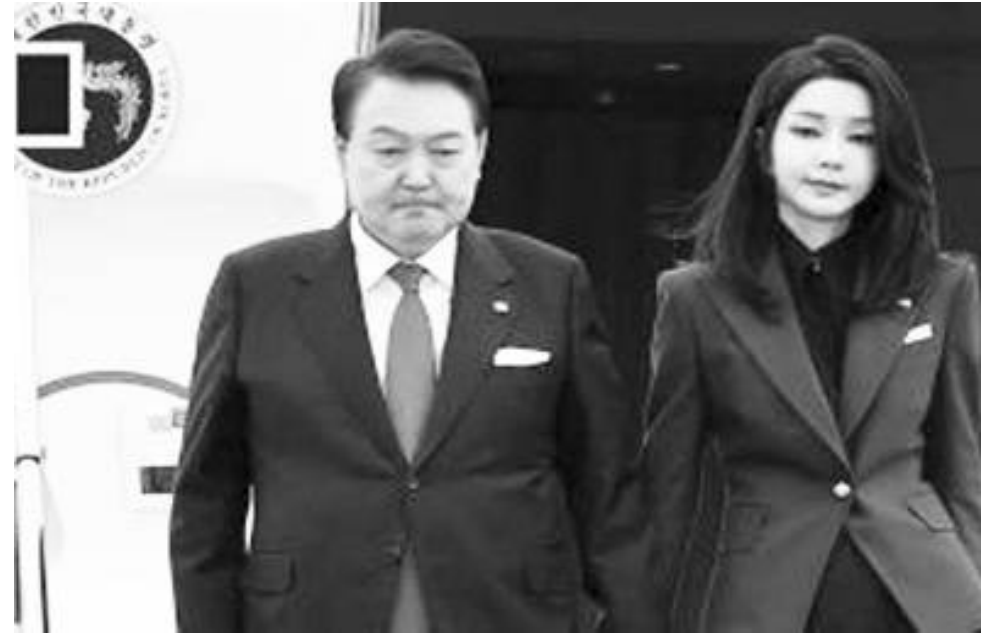
የፕሬዚዳንት ዩን ሱክ የኦል ባለቤት በሙስና ወንጀል ተጠርጥረዋል

የን የቦርሳውን ቅሌት በተመለከተ በየካቲት ወር ባደረጉት የመጀመሪያ ንግግር ጉዳዩ ፖለቲካዊ ወጥመድ ነው ሲሉ አጣጥለውት ነበር። ዩን እንዳሉት ባለቤታቸው ኪም ስጦታውን የተቀበሉት አልቀበልም ለማለት አስቸጋሪ ስለሆነባቸው ነው ነበር ያሉት። ነገርግን ዩን ዘግይቶ ብለው በግንቦት በስጦት መግለጫ የባለቤታቸው ስጦታ መቀበል ተገቢ አለመሆኑን በመግለጽ ይቅርታ ጠይቀዋል።