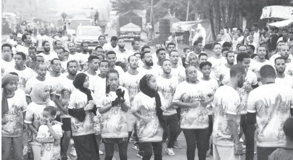
በውድድሩ ከ16ሺ በላይ ሕዝብ በአምስት ኪሎ ሜትር ተሳትፏል።

ብርቱ ፉክክር ባስተናገደውና በወንዶች መካከል በተካሄደው ውድድር የ3ኛውና የአምናው አሸናፊ አትሌት ጨምሮ ደበላ በግል ዳግም የዘንድሮው ውድድር ባለድል ሆኗል። እሱን ተከትሎ የአካባቢው ክለብ ዘቢዳር ያፈራው አትሌት ዘነበ አየለ ሁለተኛ በመሆን ውድድሩን