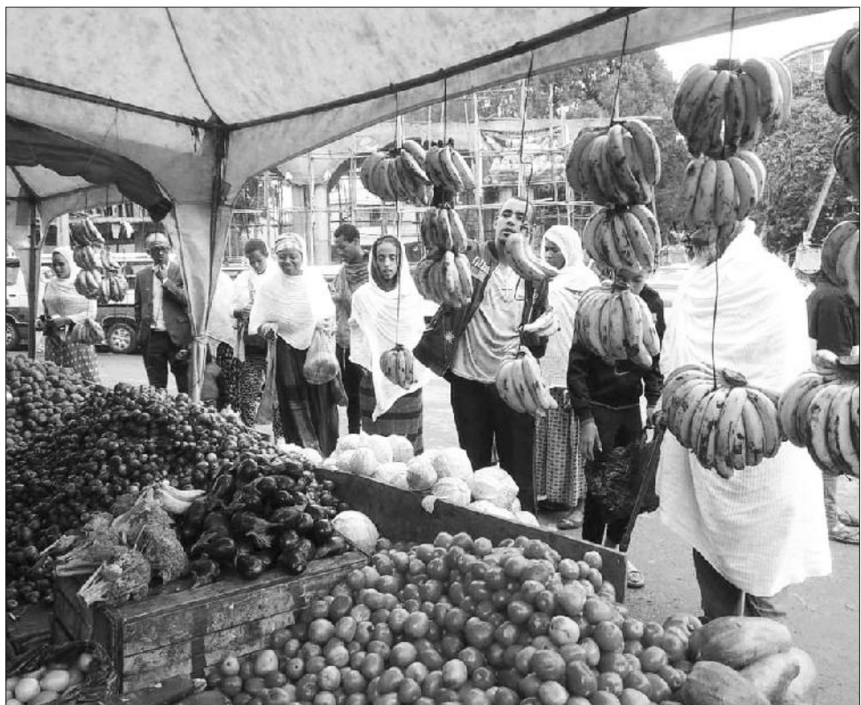
በክልሉ የሚገኙ 377 የሽማግሌ ማኅበራት የገበያ ማረጋገጫ ሥራ ሠርተዋል

በክልሉ አሾካዶ፣ አናናስ፣ ማርና ቅቤ በብዛት የሚገኝ በመሆኑ ማኅበራቱ ከክልሉ አልፎ አዲስ አበባ በተገነቡ የገበያ ማዕከላት የተለያዩ ምርቶችን እያቀረቡ እንደሚገኙ