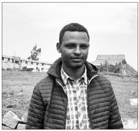
ስት ስዲሱ ከተማ