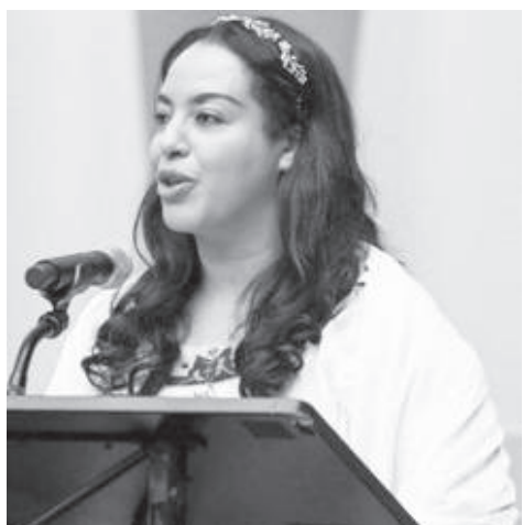
የሴቶችና ማህበራዊ ጉዳይ ሚኒስትር ኤርጌ ተስፋዬ(ዶ/ር)

ሚኒስትሯ በመርሐ ግብሩ ኢትዮጵያ ያለ ዕድሜ ጋብቻና የሴት ልጅ ግርዛት ለመከላከል በሠራቸው ሥራ