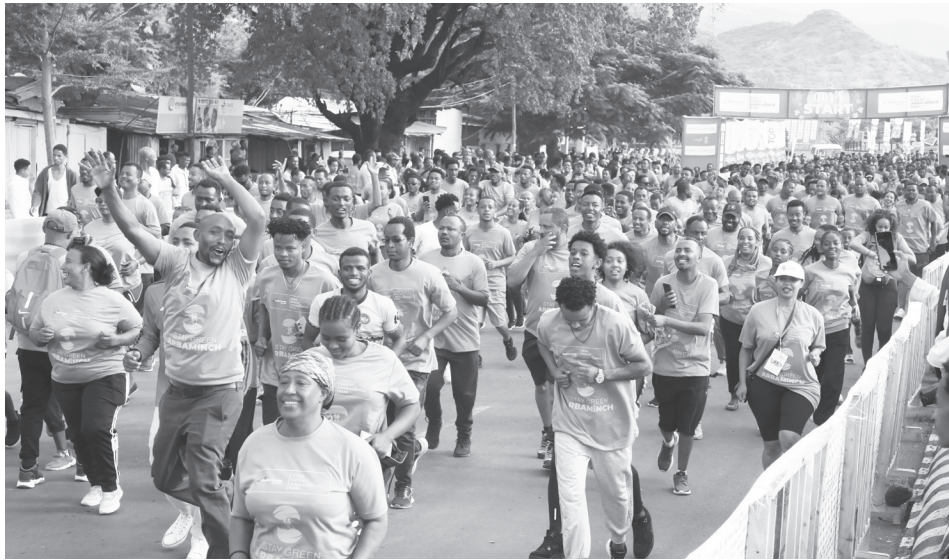
በአርባምንጭ የመጀመሪያ በሆነው ታላቁ ሩጫ ላይ 2 ሺ700 የሚሆኑ ሰዎች ተሳትፈዋል።

«አርባምንጭን አረንጓዴ አድርጎ ማስቀጠል» የሚል መሪ ሃሳብን ያገለገለው ሩጫ፣ የአካባቢ ጥበቃ ላይ ያተኮረ መርሃግብር የጥላስቲክ ምርት በመቀነስ፣ እጽዋትን በመትከል እና አየርን ሊበከል የሚችል ነገርን በማስወገድ ነፋሻማ ሩጫን ለማካሄድ በሚል በተሳታፊው ከተማዋን በማጽዳት