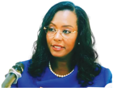
ወይዘሮ አዳኝ ስበቤ