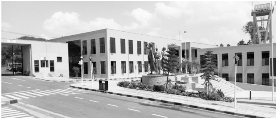
ማዕከሉ አቅሙን ማሳደግ ከቻለ በሕንድ ገዜ 2 ሺ ሴቶችን ተቀብሎ የማስተናገድ አቅም አለው።

ሴቶች በሕይወታቸው ልዩ ልዩ ችግሮች ይገጥማቸዋል። እነዚህ ችግሮች ማህበራዊ አልደም ኢኮኖሚያዊ ሊሆኑ ይችላሉ። ኑሯቸውን ለማሸነፍ ሲሉ ወደተለያዩ ዓረብ ሀገራት ተሰደው ስንት ደክመው የሠሩበት ሳይከፈላቸው ባዶ እጃቸውን የሚመለሱ ሴቶች ጥቂት አይደሉም። በቤተሰብና በተለያዩ ኢኮኖሚያዊ ችግሮች ምክንያት ሳይፈልጉ ኑሯቸውን በሴተኛ አዳሪነት የሚገፉም ብዙ ናቸው። እጅ አጥሯቸው በየገዳናው ወደቀው ምፅዋት የሚለምኑ ሴቶች ቁጥርም ቀላል የሚባል አይደለም።