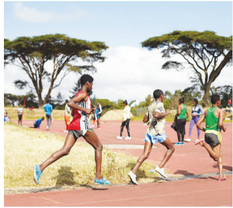
የአረንጓዴውን ስታድዮም የመረጫ መም ሰማላደስ 18 ሚሊዮን ብር እንደሚያስፈልግ ተጠቁሟል።

ስታድዮሙን ለማደስ ለሚደረገው ጥረት ውስጥ የክልሉ ወጣቶች ስፖርት ቢሮ፣ ባለሙያዎችን መድቦ የአድራጭ ጥሪ አስጠንቅቶ ያጠናቀቀ ሲሆን፤ በአሁኑ የገበያ ጥጋ 18 ሚሊዮን ብር ተገምቷል። ይህንንም የኢትዮጵያ