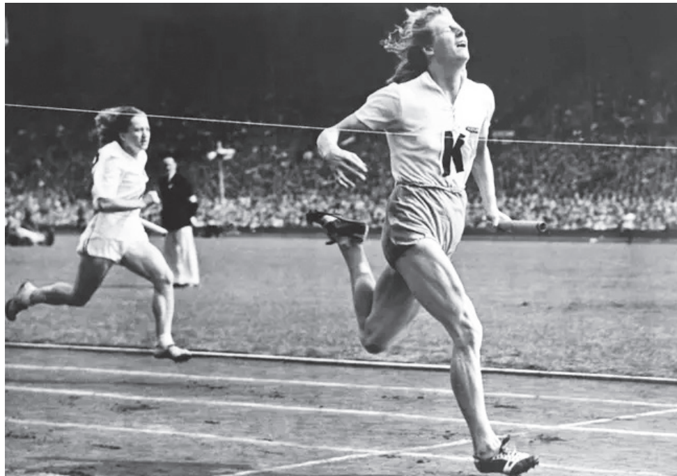
ኔዘርላንዳዊት አትሌት ፍራንሲዜ ኮይን

የአሊምፒክ ጀግናዎ አትሌት ፍራንሲዜ ኮይን ትባላለች። የሆላንድ ተወላጅ ናት። አትሌቷ እ.ኤ.አ በ1935 የስፖርቱን ዓለም ብትቀላቀልም የነበራት ተሰጥቶች ችሎታ በቀጣዩ ዓመት በርሊን ላይ በሚካሄደው አሊምፒክ ሊያሳትፋት የሚችል ነበር። ነገር ግን ከአሊምፒኩ መካሄድ አስቀድሞ ሁለተኛው የዓለም ጦርነት በመነሳቱ ህልጋ ሊሳካ አልቻለም። በዚህ መካከልም የስፖርት