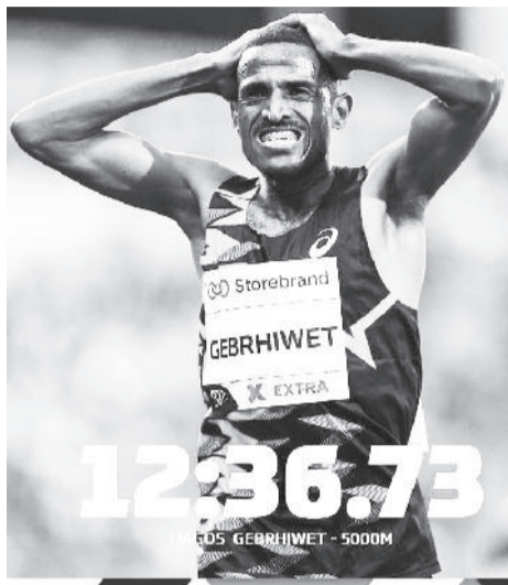
ሐንስ ገብረህይወት ሁለተኛውን የ5ሺ ሜትር ፈጣን ሰዓት አስመዘገቧል።

በ5ሺ ሜትር ርቀት በመሮጥ የሚታወቀው አትሌቱ እኤአ 2013ቱ የሞስኮ ዓለም ቻምፒዮናት የብር ሜዳሊያ ሲያገኝ፤ በቀጣዩ የቤጂንግ ቻምፒዮናት ደግሞ የነሐስ ሜዳሊያ አጥልቋል። በ2016ቱ የሪዮ አሊምፒክ ለመጀመሪያ ጊዜ ሀገሩን የወከለው አትሌቱ የነሐስ ሜዳሊያ ባለቤት እንደነበር ይታወቃል። ተስፋኛው አትሌት ከዚያ በኋላ ባሉት ዓመታት ተደጋጋሚ ጉዳት በማስተናገዱ ምክንያት ብቃቱን ለማሳየት ባይችልም፤ ባለፈው ዓመት ራጋ