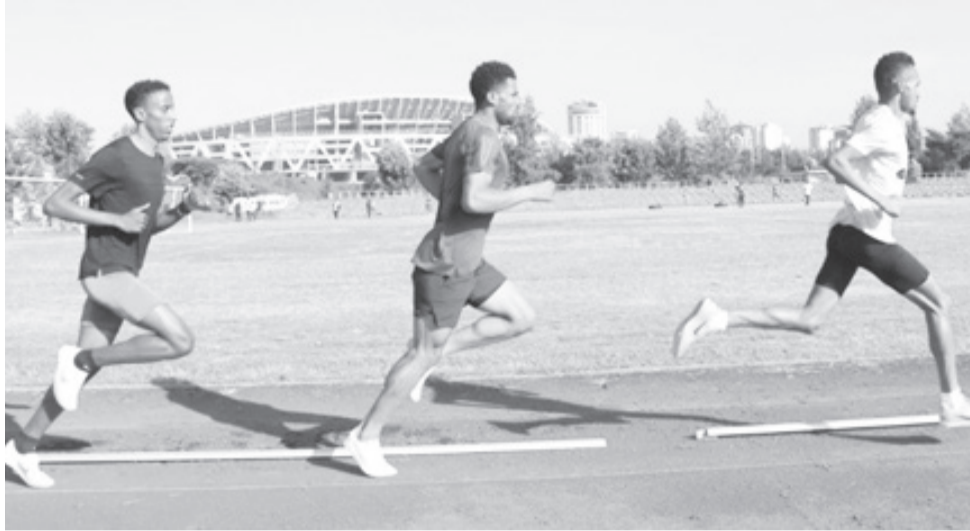
የሚሊማ ማሟያ ውድድር በፓሪስ ኦሊምፒክ ኢትዮጵያን የሚወክሉ አትሌቶች ይለዩበታል።

የኢትዮጵያ አትሌቲክስ ፌዴሬሽን በፓሪስ ኦሊምፒክ ኢትዮጵያን የሚወክሉ አትሌቶችን ለመምረጥ የማጣሪያ (የሰዓት ማሟያ) ውድድሮችን ዛሬ በሰፊን ማላጋ ያካሂዳል። በመጨረሻ ነጠላ ወር/2016 ዓ.ም በሚደረገው ኦሊምፒክ ኢትዮጵያን ከ800 ሜትር እስከ ማራቶን ባሉት ርቀቶች የሚወክሉ አትሌቶች ተመርጠው ከሚያዚያ ወር መጨረሻ አንስቶ ወደ ዝግጅት መግባታቸው ይታወቃል። ዛሬ ማላጋ ላይ በሚደረገው የሰዓት ማሟያ ውድድርም የዓለም አትሌቲክስ የኦሊምፒክ ተሳትፎ ያስቀመጠውን ሰዓት የሚያሟሉ የመጨረሻዎቹ አትሌቶች የሚለየበት ይሆናል።