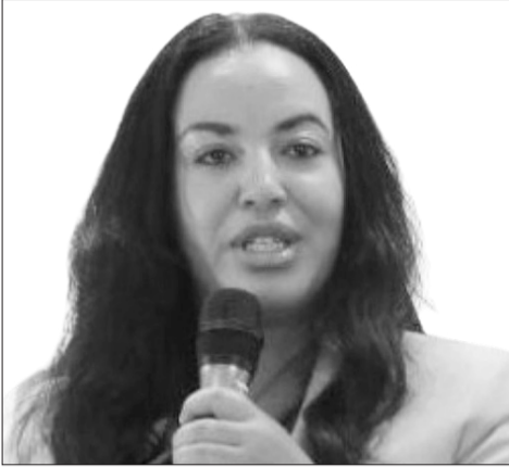
አዲስ አበባ (ዶ/ር)