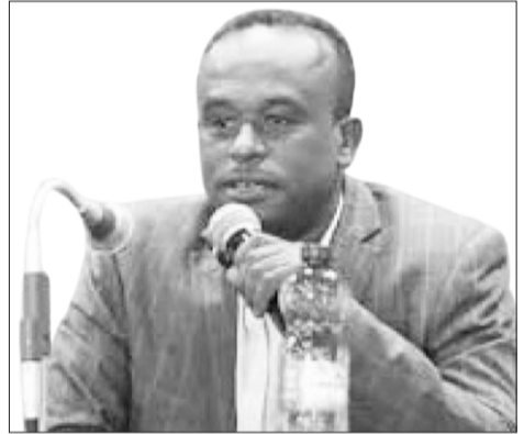
ኮሚሽኔር አሕመድ መሀመድ

አጠቃላይ ካሉት 482 ሺህ ነጋዴዎች ውስጥ የደረጃ “ሐ” ግብር ከፋይ ከሶስት መቶ በላይ መሆናቸውን ጠቅሰው፤ እነዚህ ግብራቸውን በቁጥጥር በዓመት አንድ ጊዜ የሚከፍሉ በመሆኑ ከሰው ንክኪ እንዲላቀቁ ማድረግ መቻሉን አስገንዝበዋል።