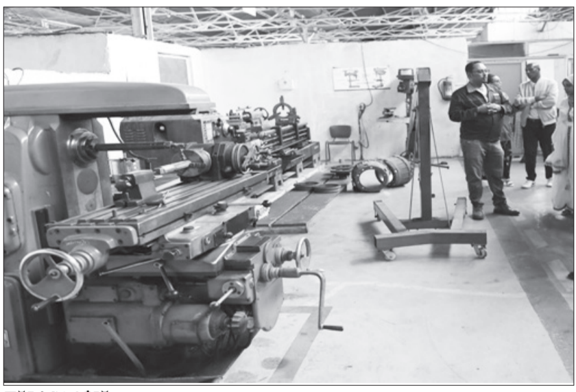
ማሸን ክፍል ሲገበኝ