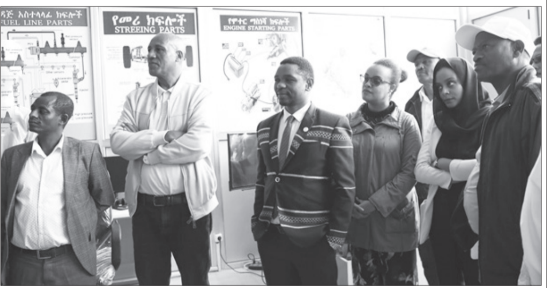
አሽከርካሪ ተሸከርካሪ ክፍል ሲገበኝ