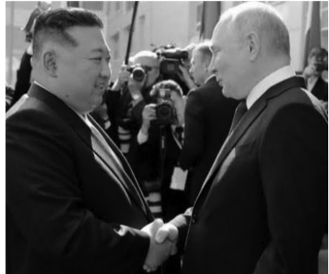
ተስማምተዋል ተብሏል። በተጨማሪም የቀጣናውን ብሎም ዓለምአቀፍ ሰላምን

ሁለቱ ሀገራት አንዳቸው የሌላኛቸውን ጥቅም የሚጸረር ስምምነት ከሦስተኛ ሀገር ጋር እንዳይፈራረሙ እና ግዛታቸውንም ደህንነት እና ለ-አዳኒት ለሚጎዱ ሌላ ሀገር ላለማስጠቀምም