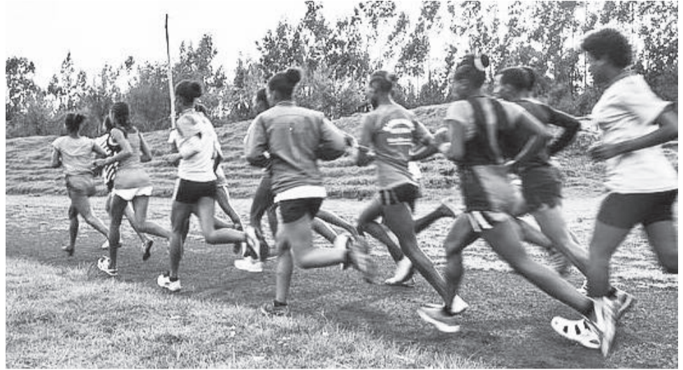
በርካታ ወርቅማና ታሪካዊ ጾሲምፒዮንን ያፈራችው በቆጂ።