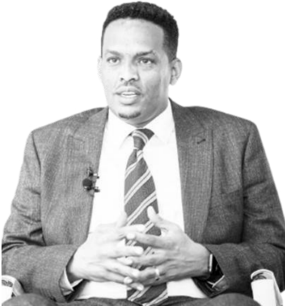
ፊቶ- ስኮፍ ገደታ

በአጠቃላይ በአዲስ ገዳና የሚገኘው የሐረር ክልል ከሰው ሠራተኛ ሥራዎችና ቀጣይ ሥራዎች ዙሪያ ከርዕሰ መስተዳድሩ ጋር የተደረገው ቅይዛ እንደሚከተለው ቀርቧል፡ መልካም ንባብ፡፡